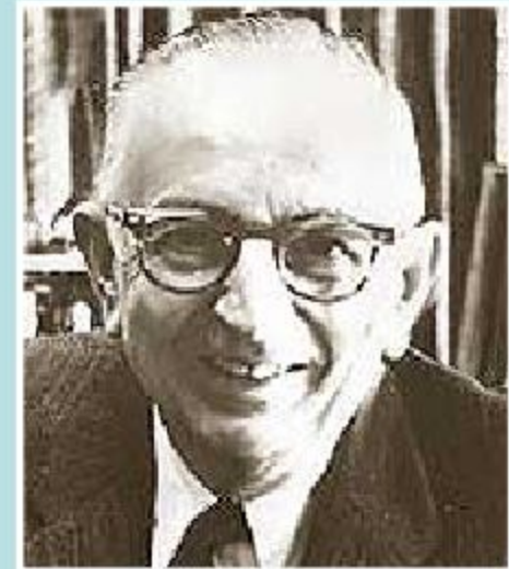
Уарен Уивер Warren Weaver (1894-1978)