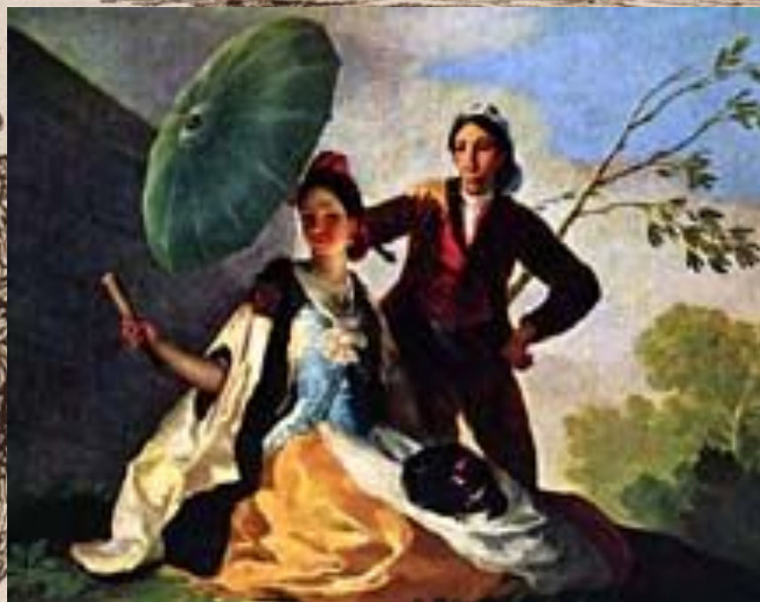
Франсиско Гойя. Зонтик. Эскиз гобелена. 1777 год. Прадо. Мадрид.