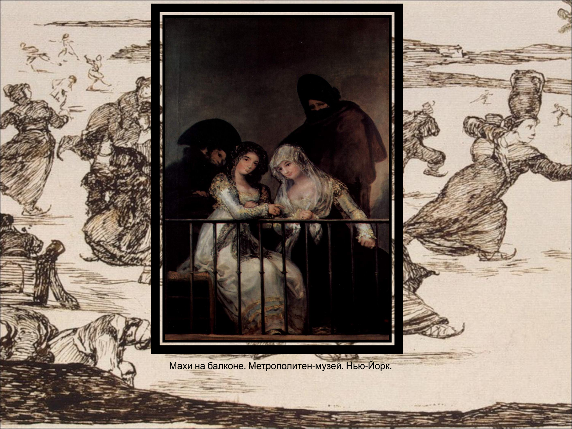
Махи на балконе. Метрополитен-музей. Нью-Йорк.