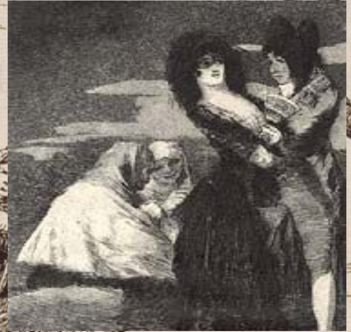
Капричос № 5

Один другого стоит. Немало было споров о том, кто хуже: мужчины или женщины. Пороки тех и других происходят от дурного воспитания. Распутство мужчин влечет за собой разврат женщин. Барышня на этой картинке так же безрассудна, как и щеголь, беседующий с нею, а что до двух гнусных старух, то они друг друга стоят.