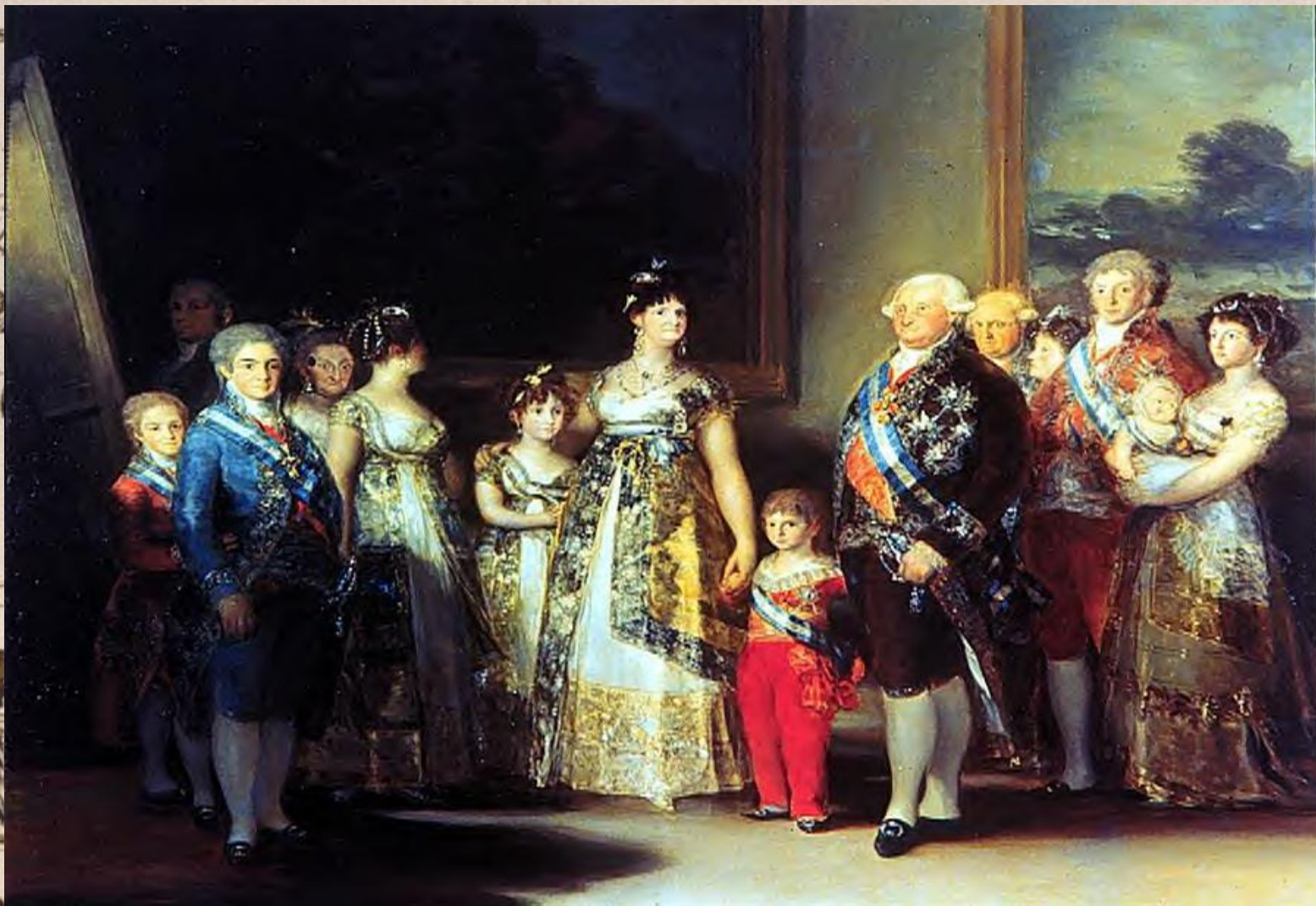
Портрет королевской семьи