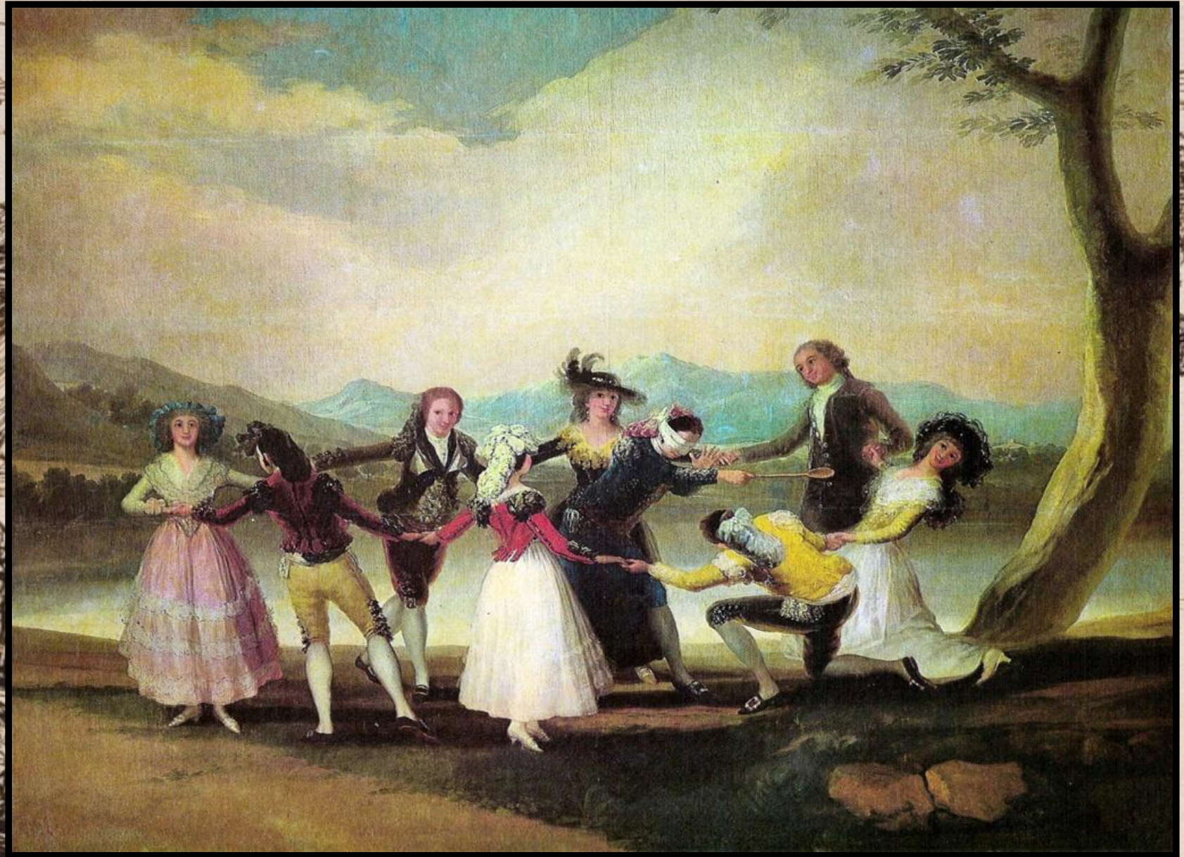
Игра в жмурки