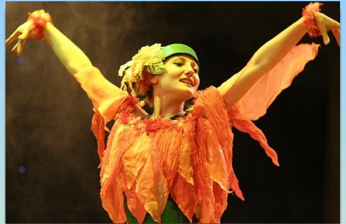
Танцювальні колективи НЮУ ім. Ярослава Мудрого