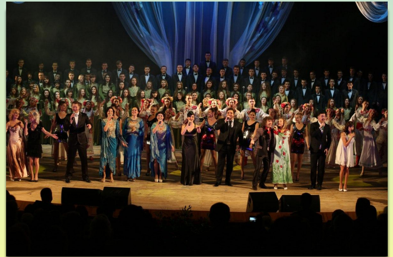
Вокальна студія "Домінанта"