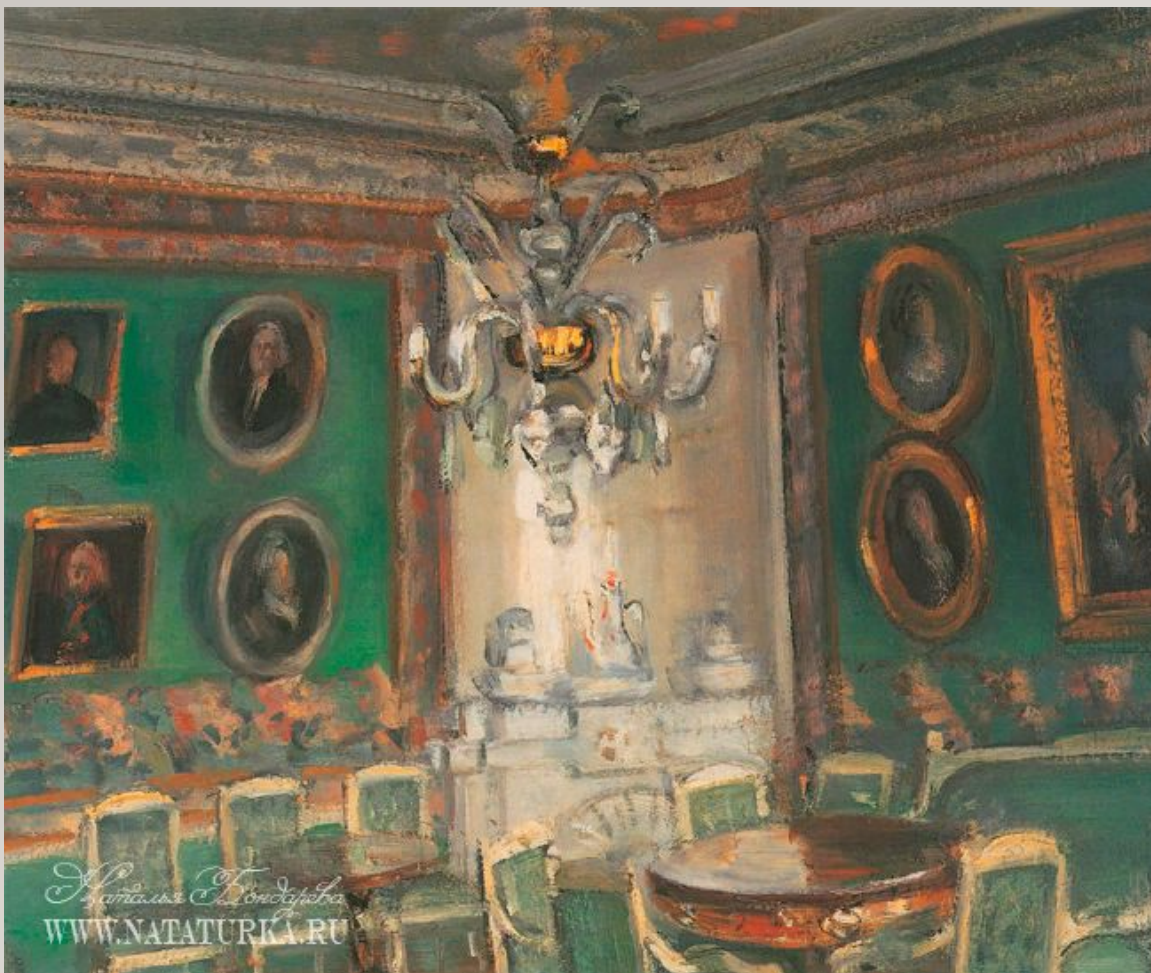
Средин А. В. Гостиная с портретной галереей в усадьбе Гончаровых «Полотняный завод» в Медынском уезде Калужской области. Середина 1910-х гг. ГИМ