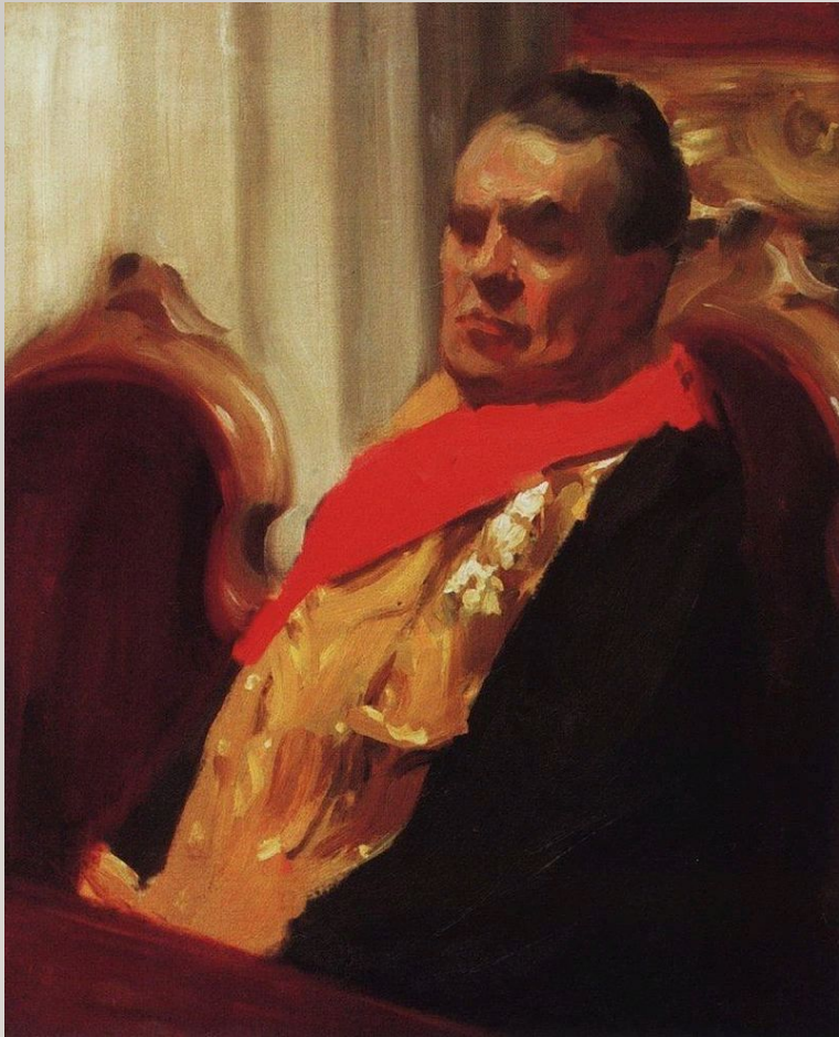
Пример портретного этюда к картине, выполненного Б. Кустодиевым