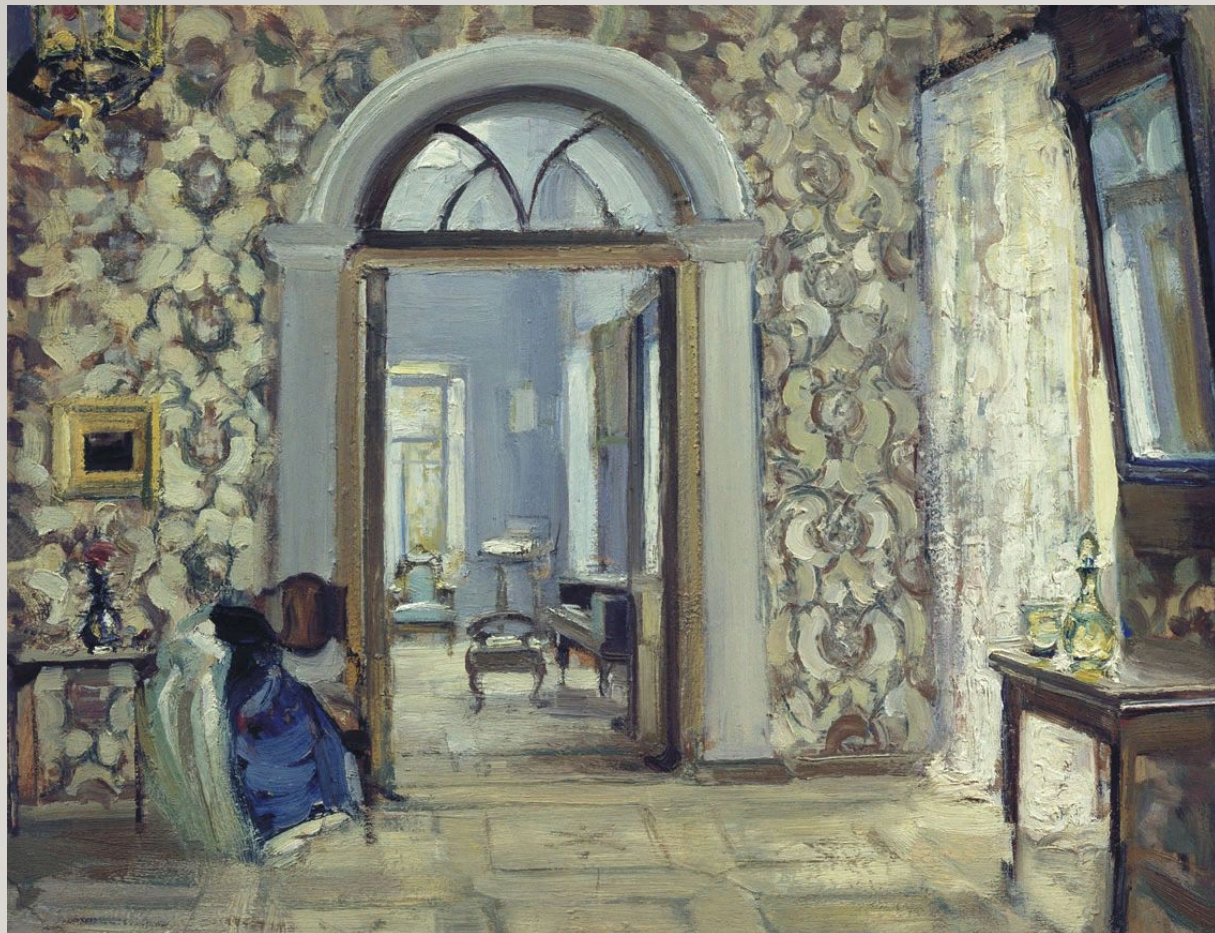
Средин А. В. Комната в имени Обнинских "Белкино". 1907 Картон, масло. 45 x 58 см

Государственная Третьяковская галерея, Москва