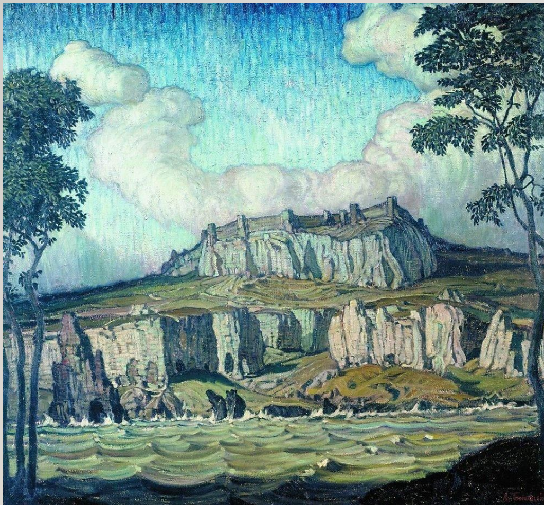
К.Ф. Богаевский. Берег моря. 1907. Холст, масло. 141 x 156 см