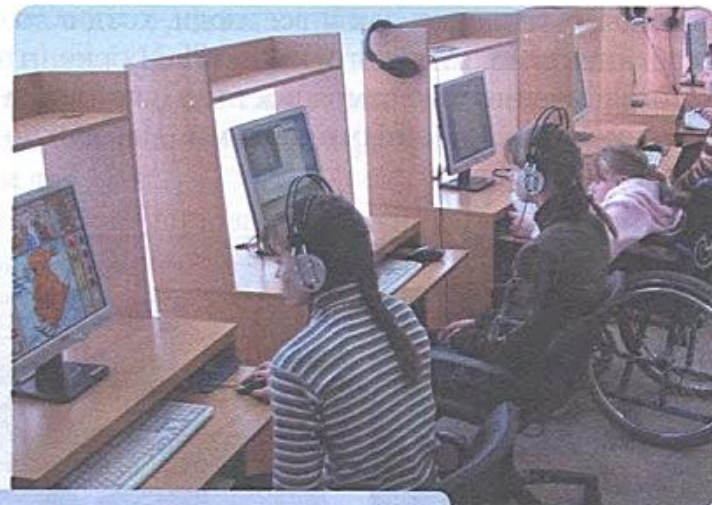
В России создаются специальные программы для обучения детей-инвалидов

■ Государство, как может, помогает инвалидам. Например, в ряде городов ходят специальные автобусы с жёлто-зелёными полосами на бортах, которые бесплатно перевозят инвалидов 1-й и 2-й групп. Государство оказывает инвалидам медицинскую помощь. Во всех регионах страны стараются обеспечить образование для детей-инвалидов, нуждающихся в обучении на дому.