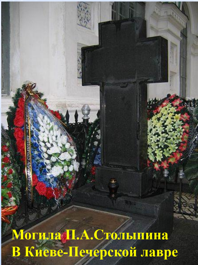
Могила П.А.Столыпина В Киеве-Печерской лавре

1(14) сентября 1911 г. П.А.Столыпин был убит в г.Киеве в присутствии Николая II