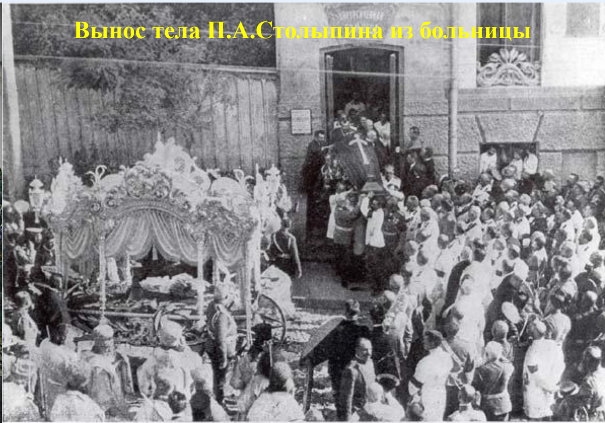
Вынос тела П.А.Столыпина из больницы