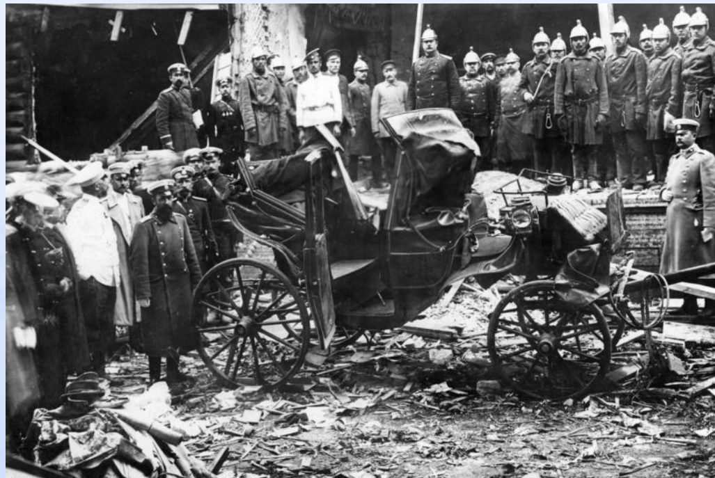
Bundesarchiv, Bild 183-R04510 Foto: o. Ang. | August 1906