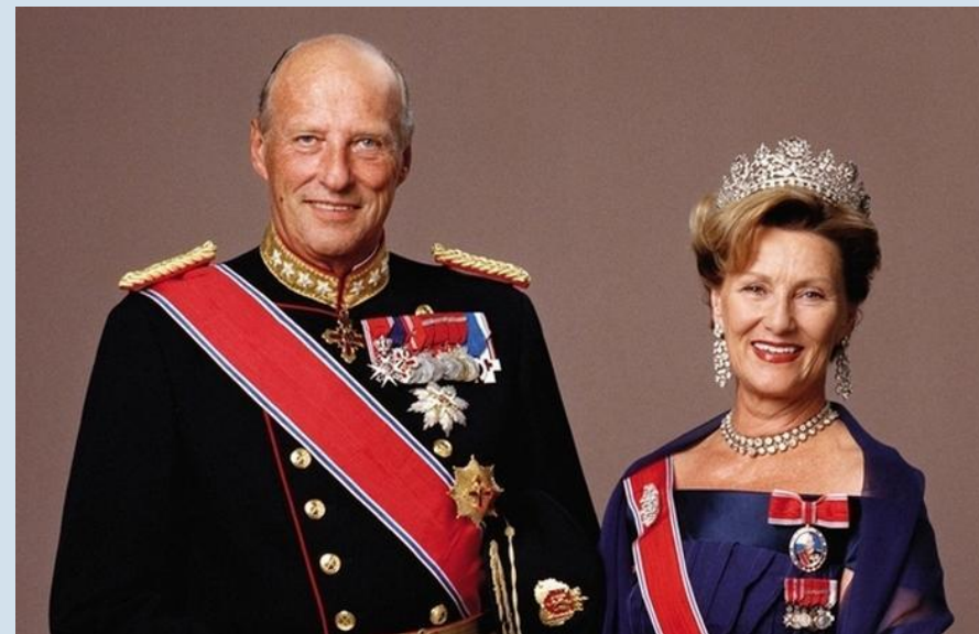
Король и королева Норвегии (Харальд V и Соня Харальдсен)