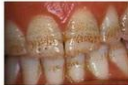
Флюороз эмали зубов