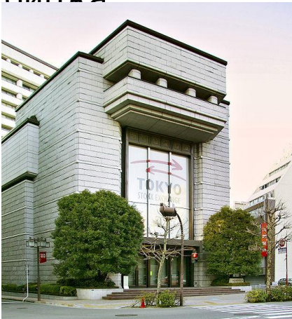
Токийская фондовая биржа