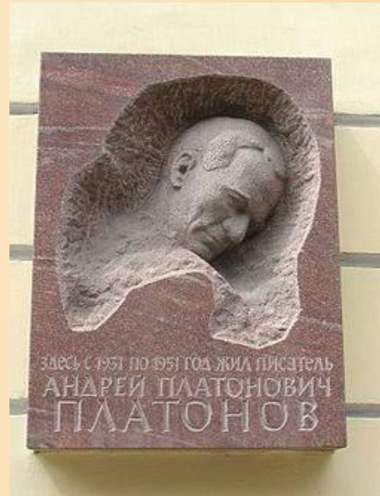
Мемориальная доска на здании Литературного института в Москве (Тверской бульвар, 25)