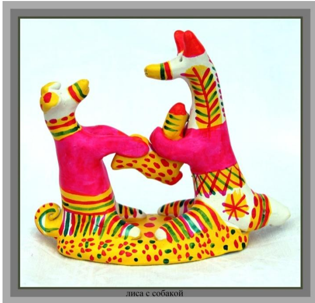
лиса с собакой