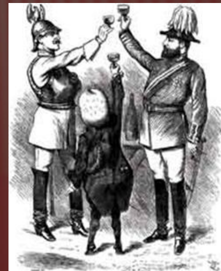
Карикатура Тире-Боне. Троїстий союз.