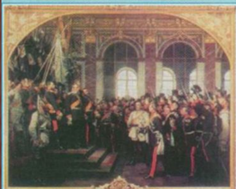
Проголошення Німецької імперії (Версаль, 1871 р.)