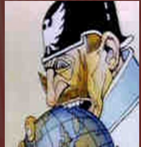
Карикатура на світові зазіхання Вільгельма II