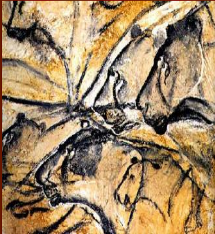
Львы из пещеры Chauvet

Начало палеолитического искусства: эпоха Ориньяк (35-30 ---- 20 тыс. лет назад)