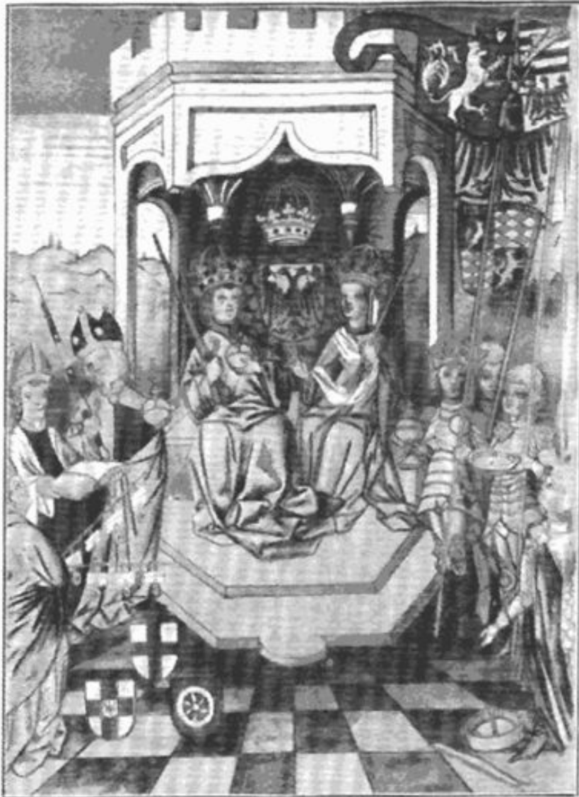
Карл IV издает Золотую Булу

Золотая булла 1356 г. (лат. Bulla Aurea ) — законодательный акт Священной Римской империи, принятый имперским рейхстагом в 1356 г.; самый известный из документов, называвшихся «Золотая булла». Текст документа, составленный на латыни, был утвержден императором Карлом IV Люксембургским.