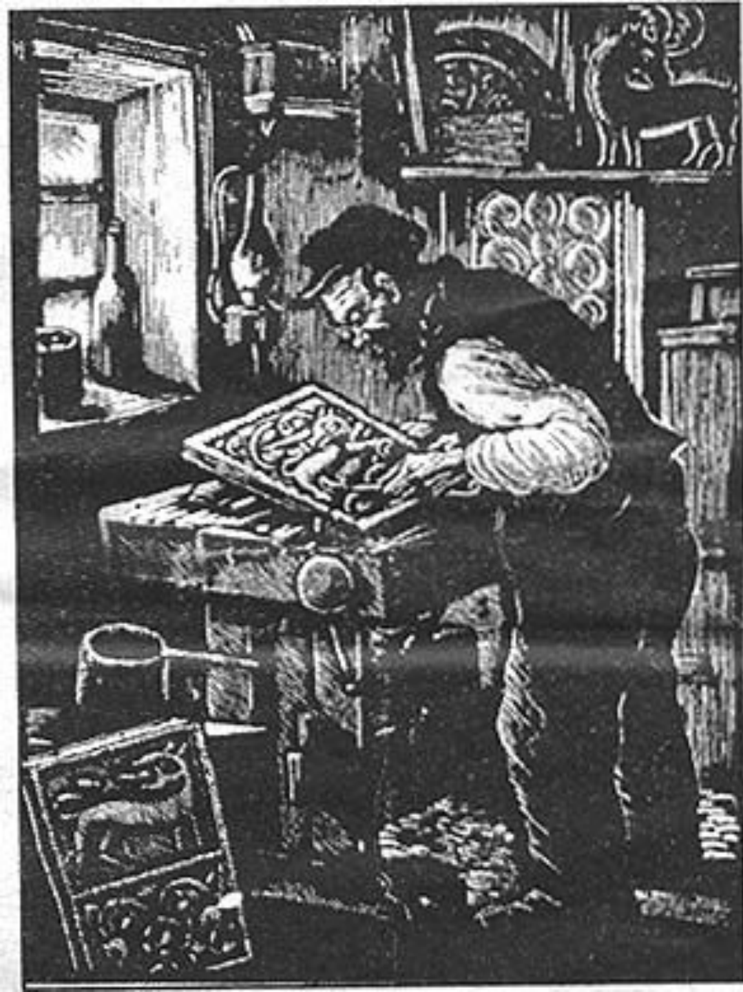
Ремесленник Германии 1247г.