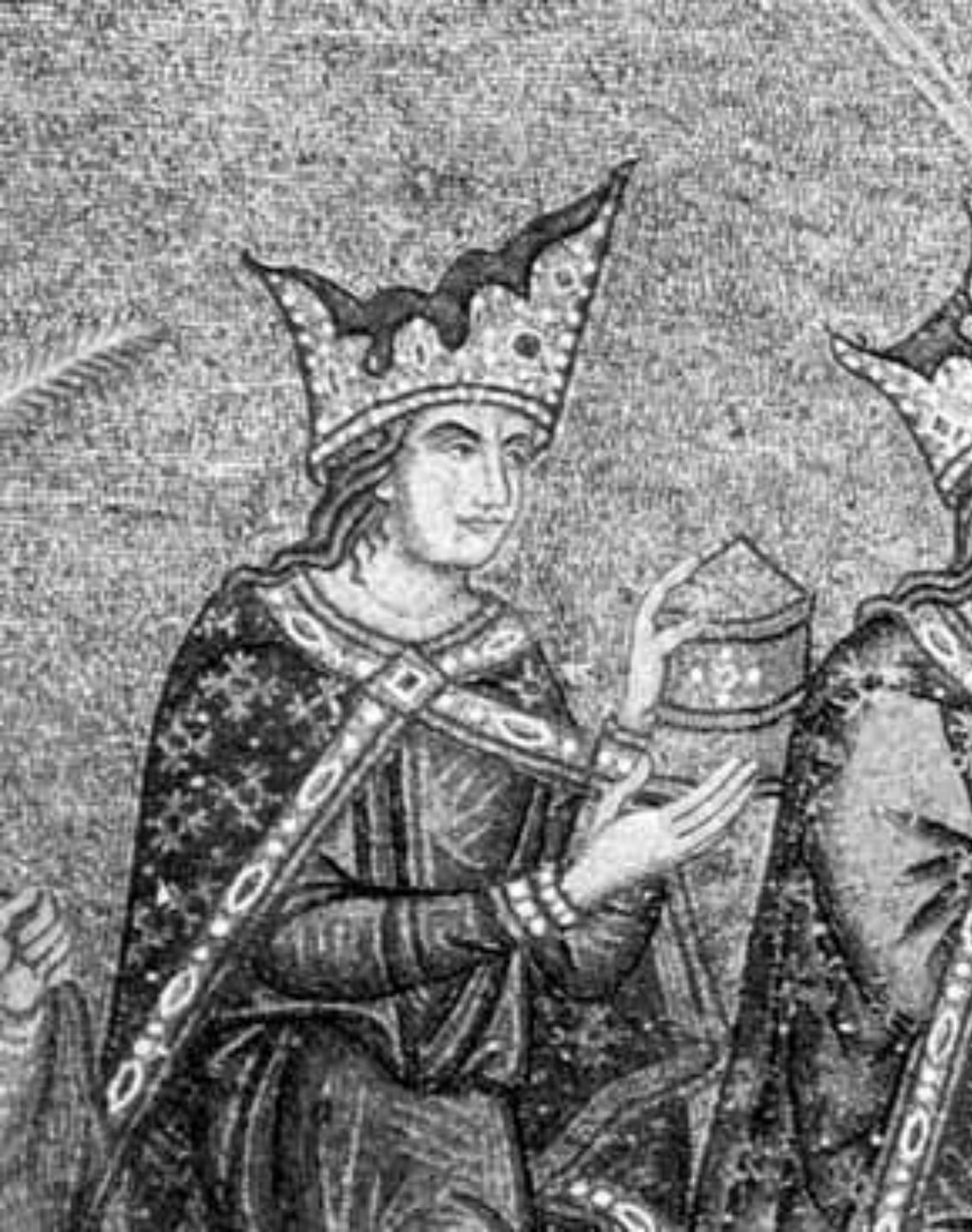
Император Оттон I