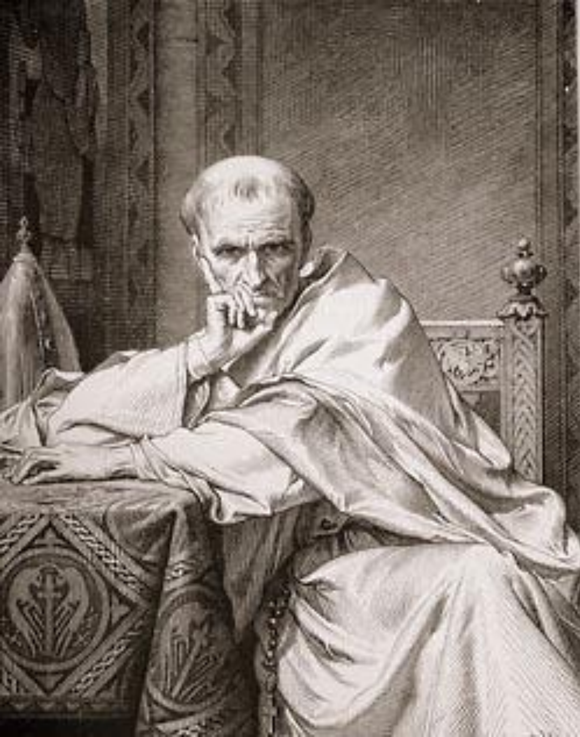
Папа Римский Григория VII