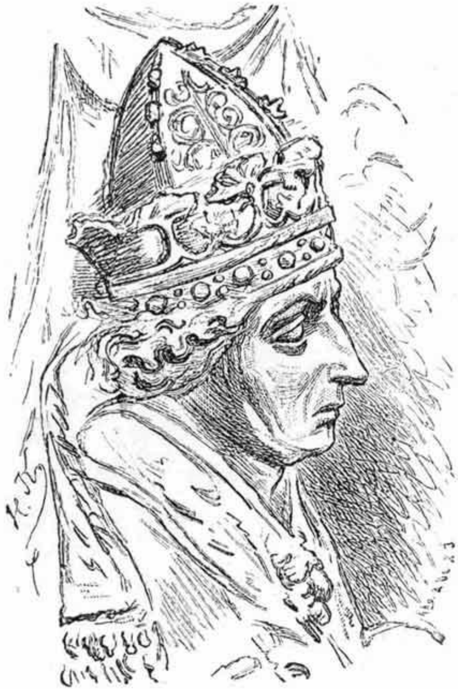
Герцог Баварский "Лев" Генрих