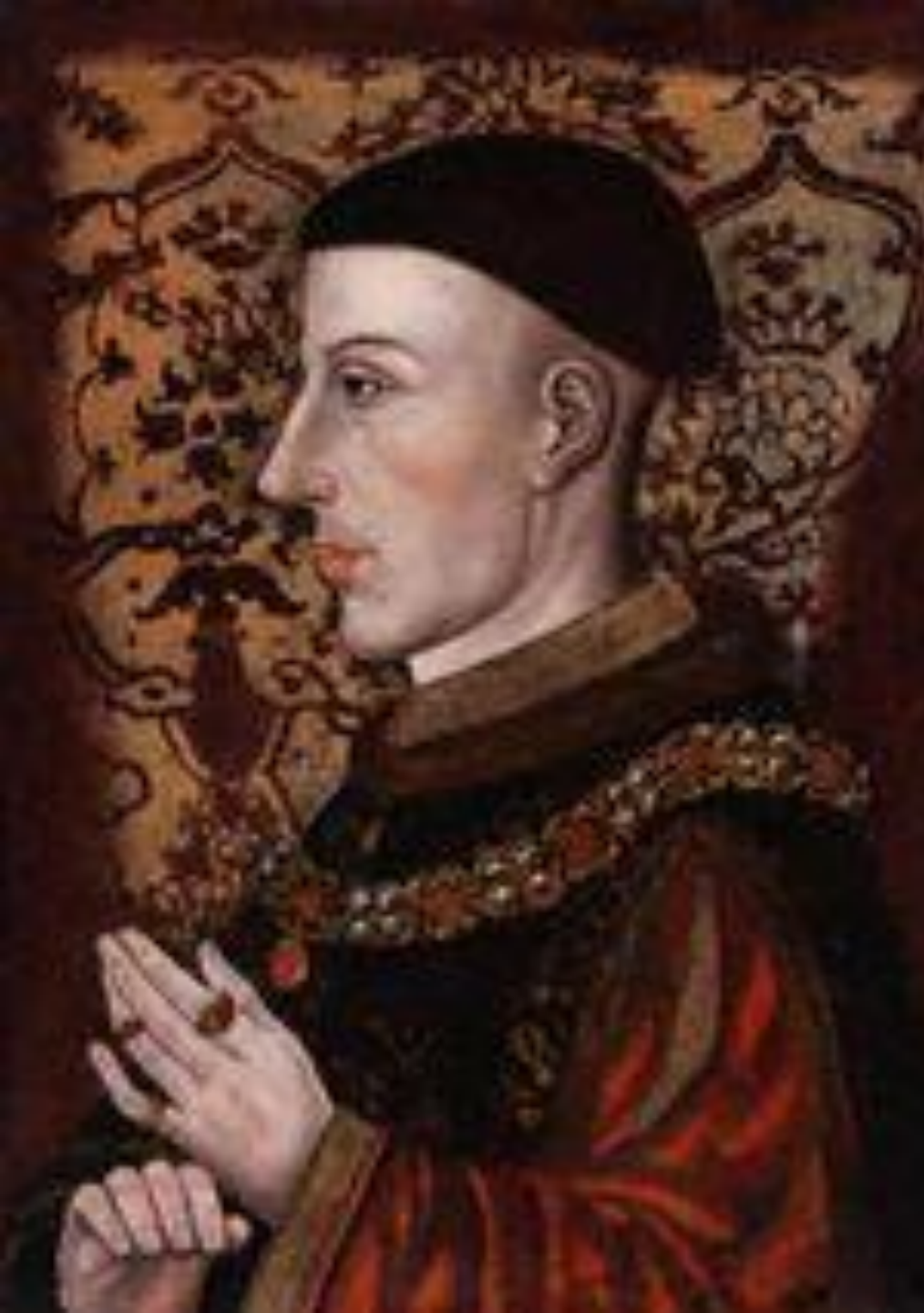
Император Генрих V