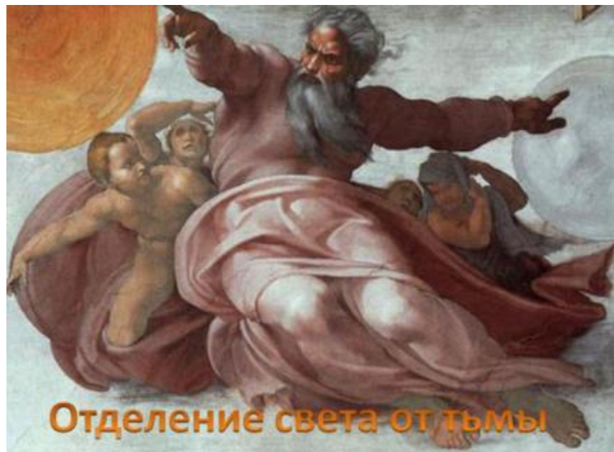
Отделение света от тьмы