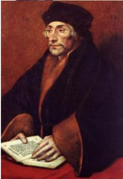
Мигель Сервантес →