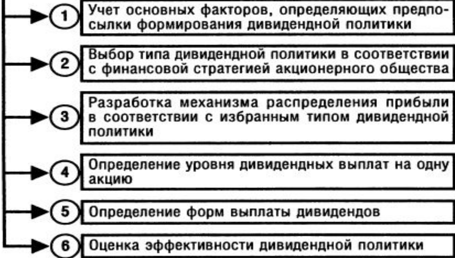
Рисунок 10.14. Последовательность формирования дивидендной политики акционерного общества.