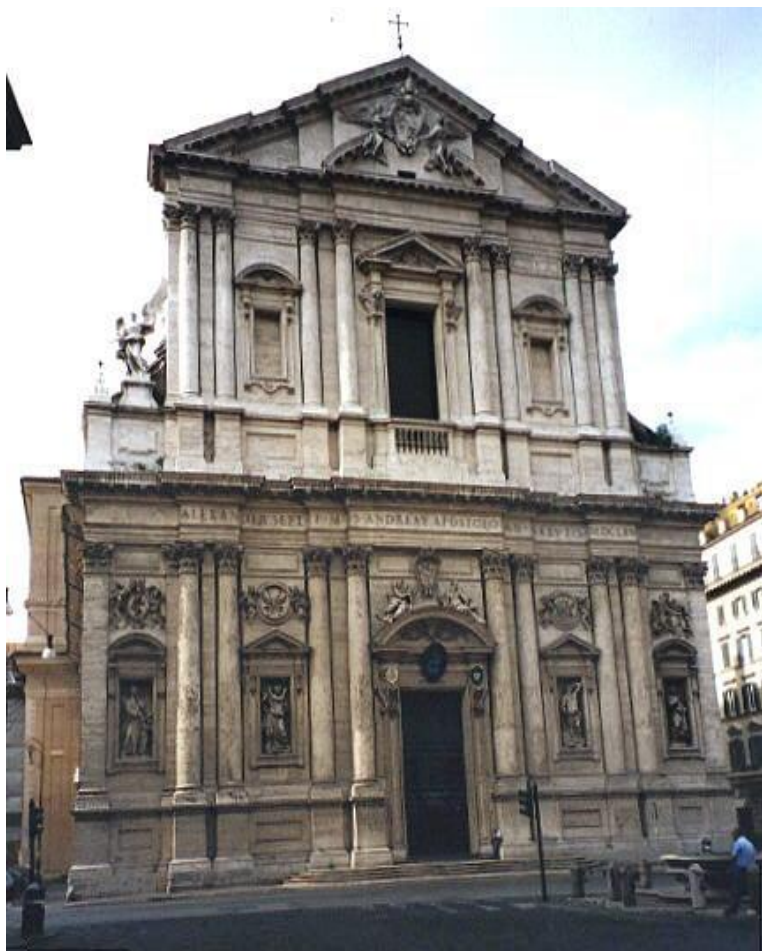
Церковь Сант - Андреа делла Валль

Архитекторы барокко не водят новые типы зданий , но находят для старых типов построек — церквей , палаццо , вилл — новые конструктивные , композиционные и декоративные приемы , которые в корне меняют все форму и содержание архитектурного образа