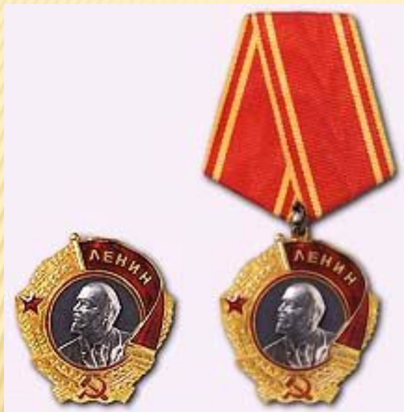
Орден Ленина вручался Герою Советского Союза с 1936 года (на колодке - с 1943 года)

Положение о звании Героя Советского Союза было впервые учреждено от 29 июля 1936 года. Оно вводило порядок вручения Героям Советского Союза ордена Ленина - высшей награды СССР - помимо грамоты ЦИК.