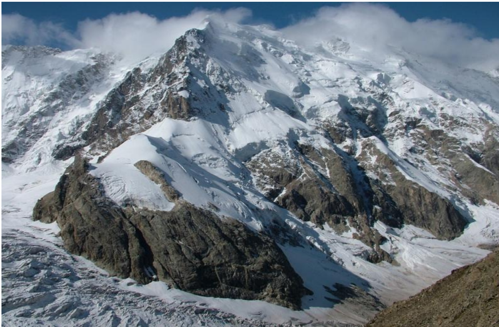
ВЕРШИНА ГЛАВНОГО КАВКАЗСКОГО ХРЕБТА ДЖАНГИТАУ – 5058 м