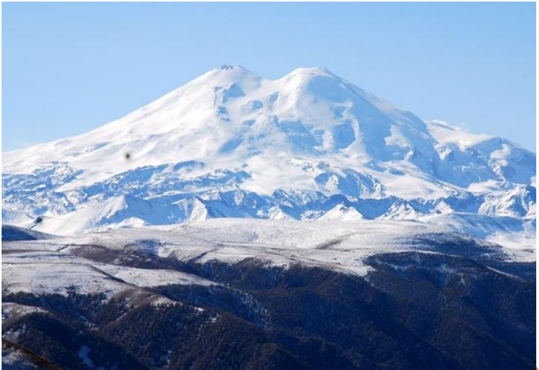
ГОРА ЭЛЬБРУС – 5642 М