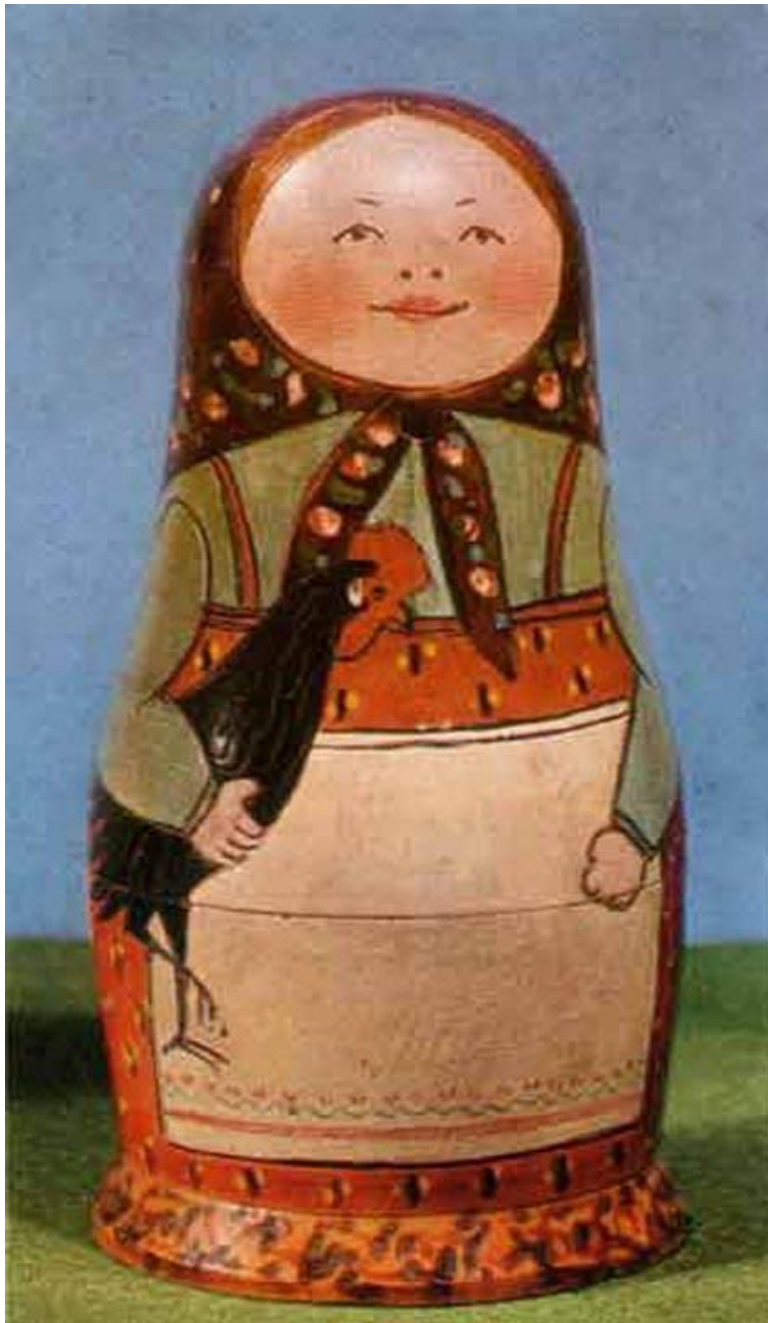
Первая русская матрешка