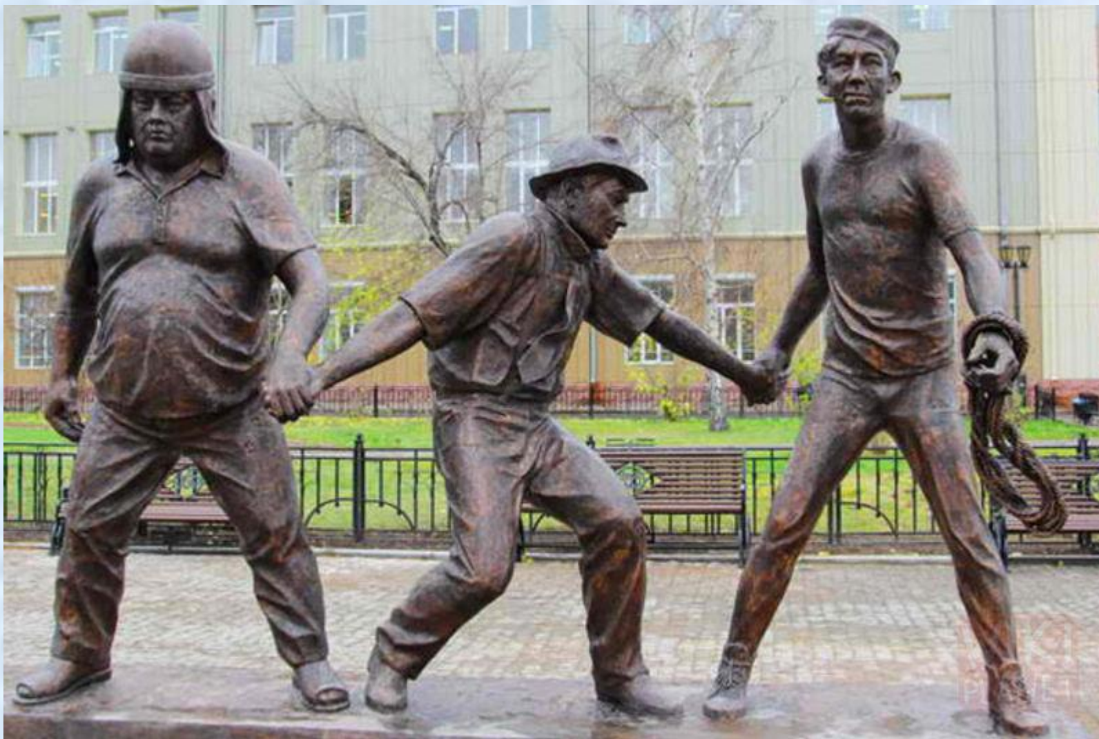
Памятник Леониду Гайдаю в Иркутске.