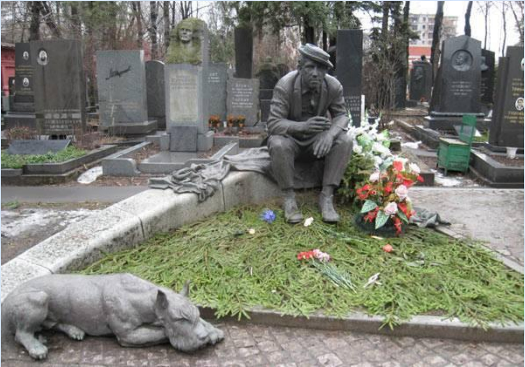
Памятник на могиле