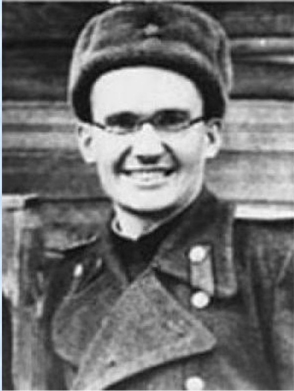
Гайдай на фронте.