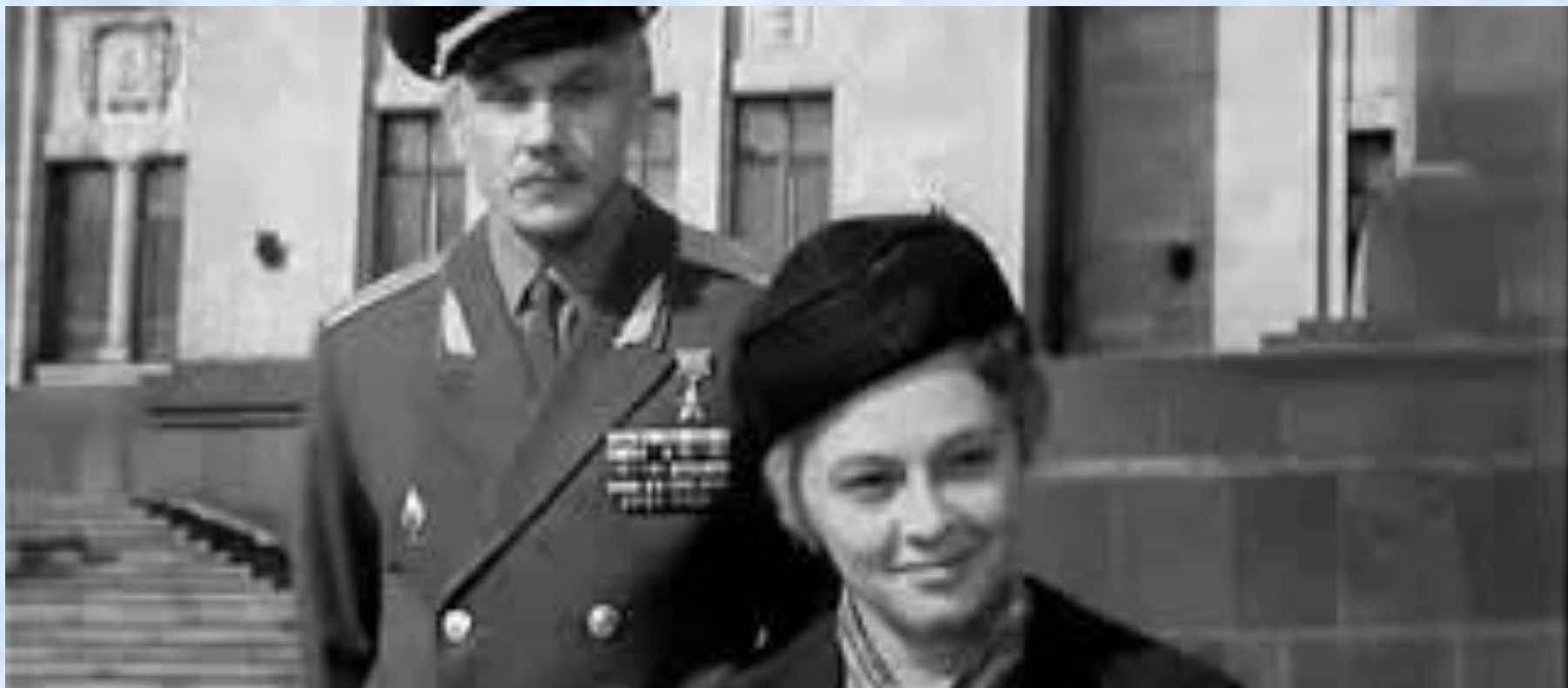
культовый советский фильм «Офицеры».