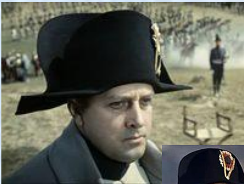
Наполеон. «Война и мир».