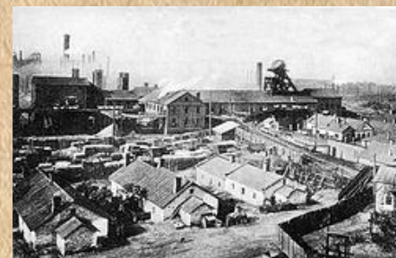
Шахта в Юзовке