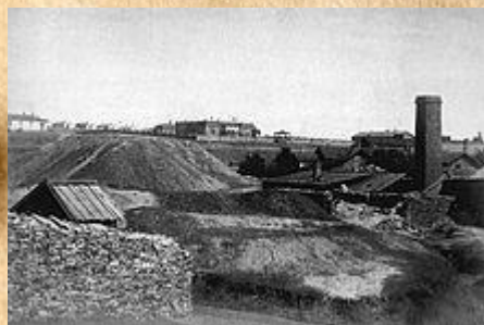
Юзовский металлургический завод