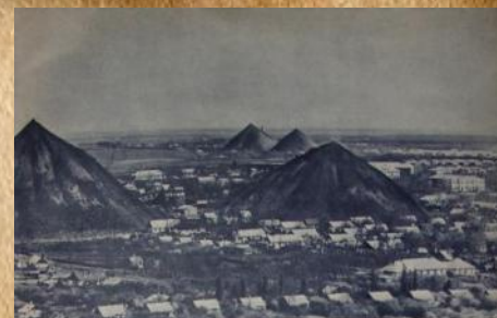
Донбасский угольный регион