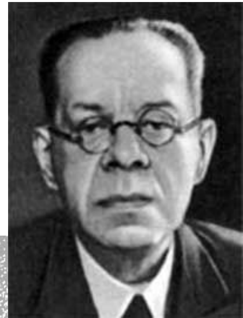
редактор М. Лозинский