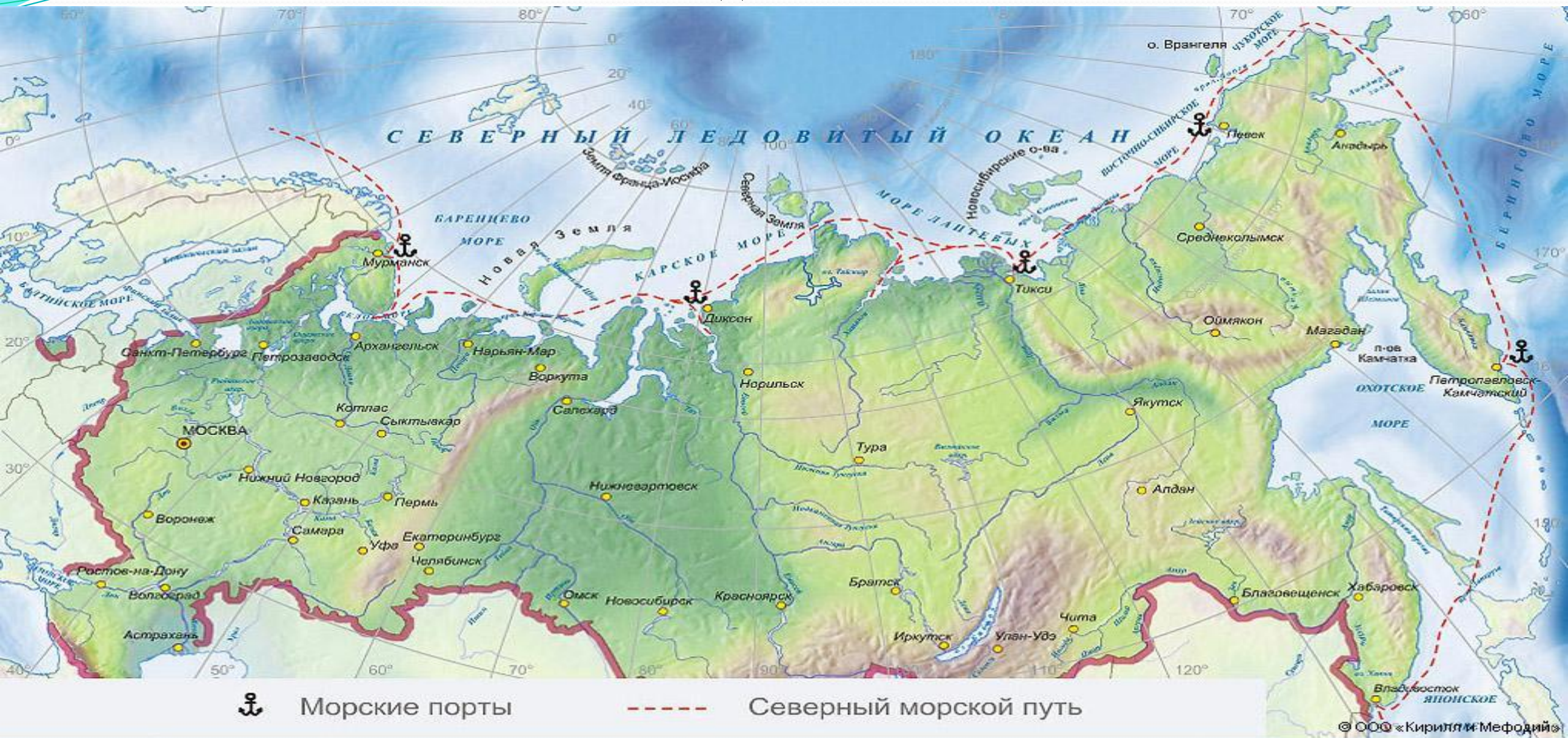
Северный морской путь. Географическая карта.