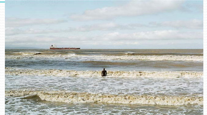
Энергия морских приливов и отливов