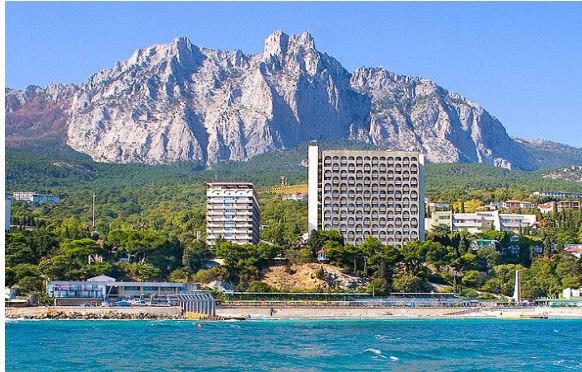
Курорты и здравницы