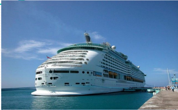
Дешевые транспортные пути