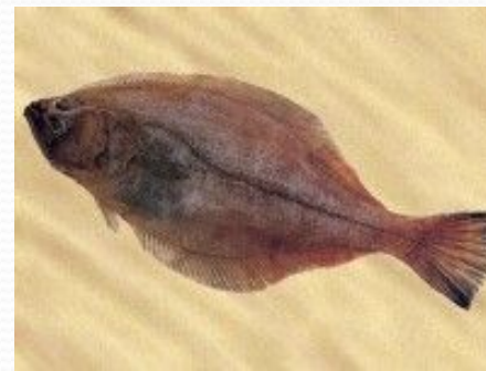
Япономорская палтусовидная камбала