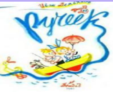
«Коммуникативное развитие. Нестандартный подход»