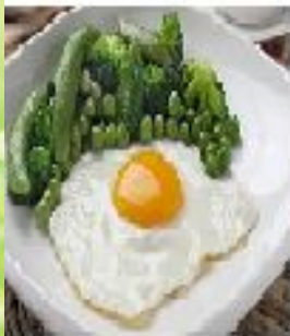
Яичница с гарниром