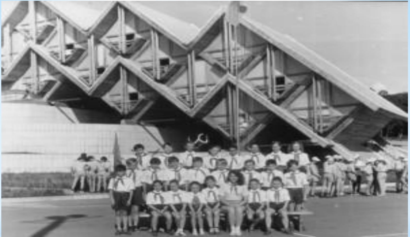
* Всесоюзный пионерский лагерь «Океан» г. Владивосток 1987 год