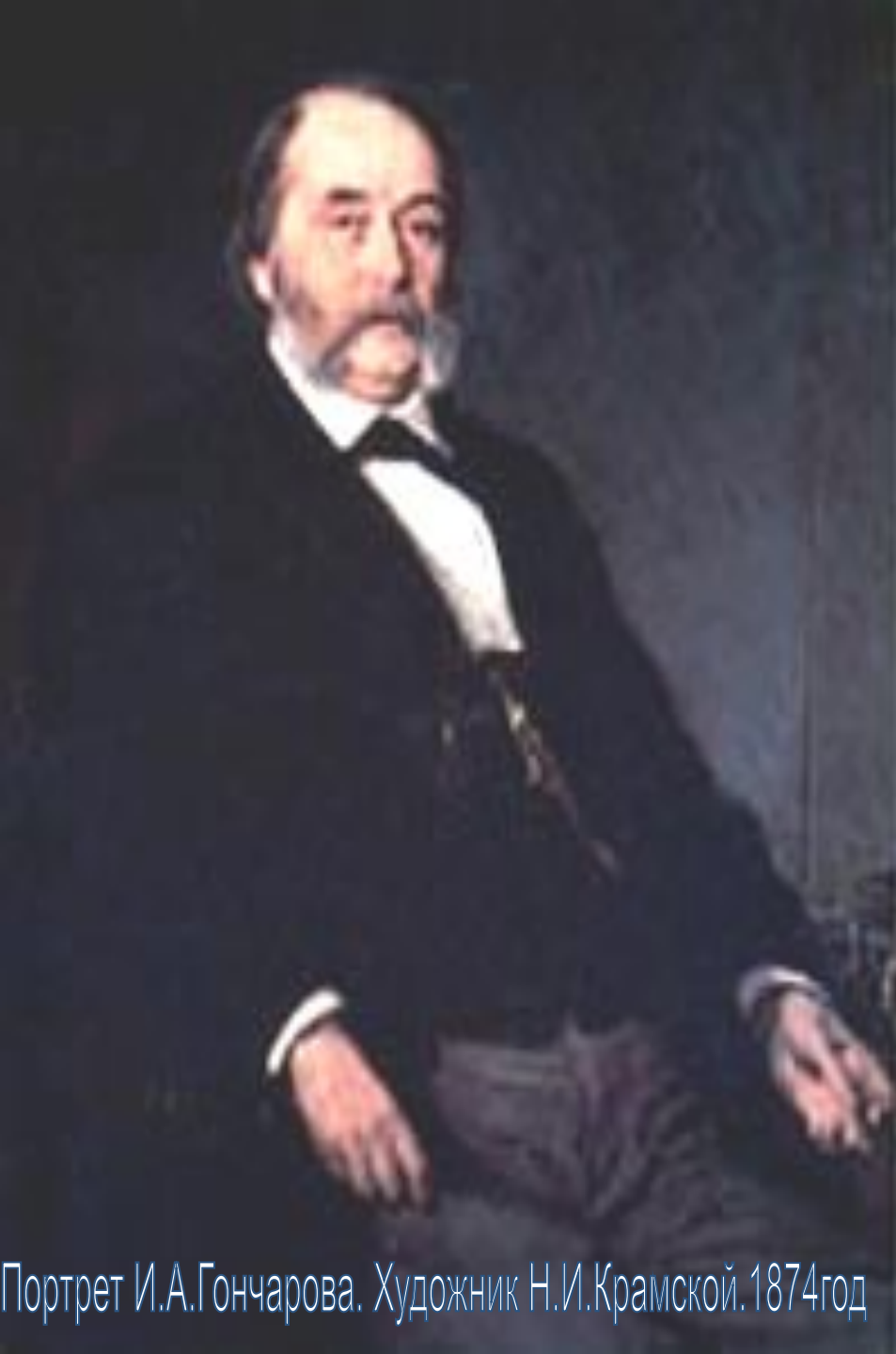
Портрет И.А.Гончарова. Художник Н.И.Крамской. 1874год