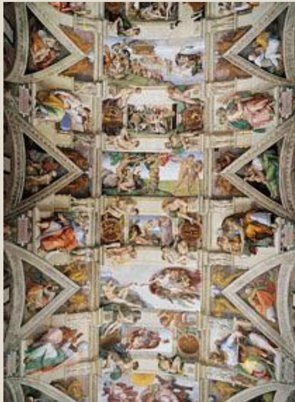
Фреска «Страшный Суд»