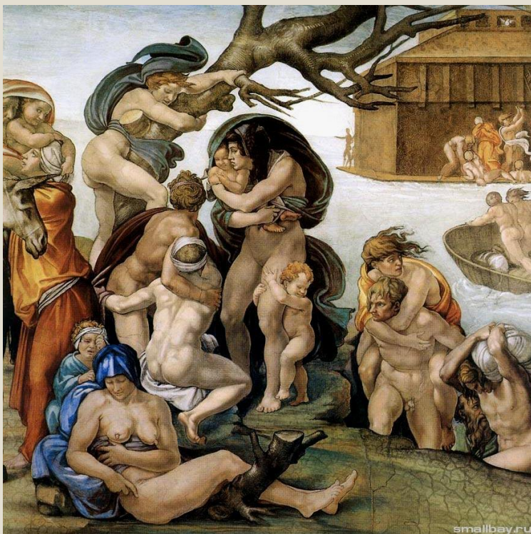
Потоп, фрагмент росписи