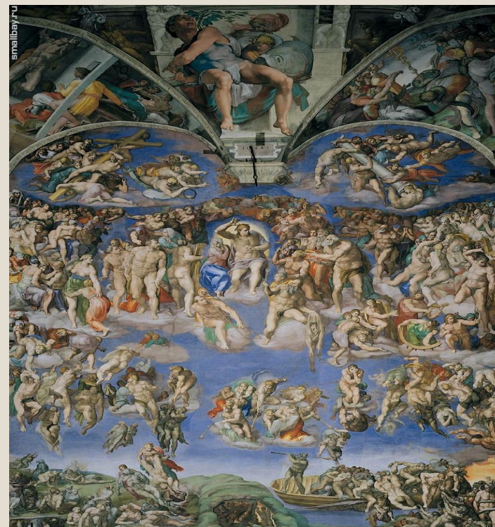
Фреска в Соборе святого Петра