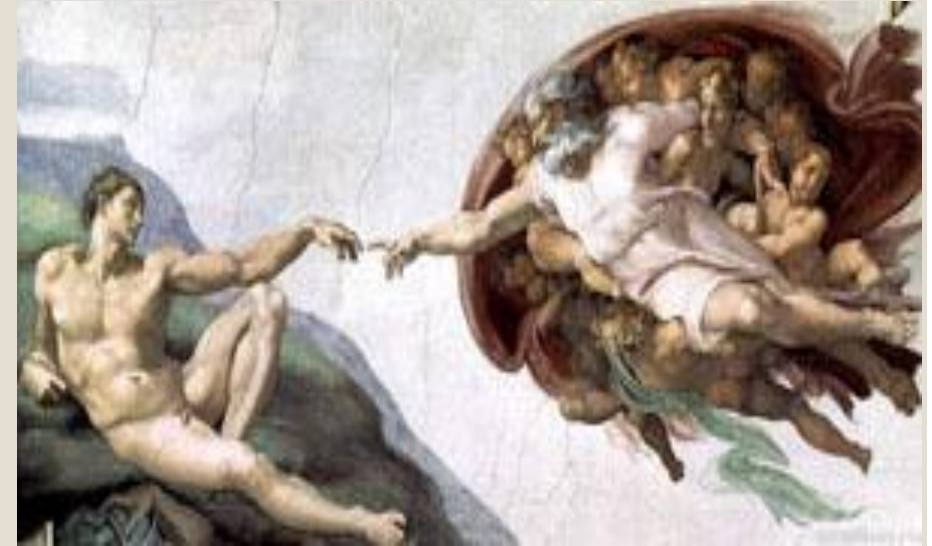
Деталь росписи: Сотворение Адама