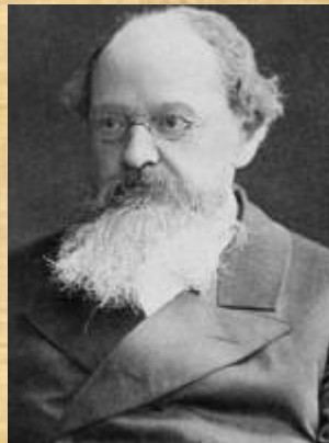
К.Д.Кавелин- автор «Записки Об освобождении Крестьян»