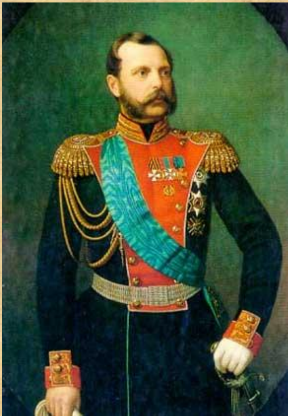
Император Александр II