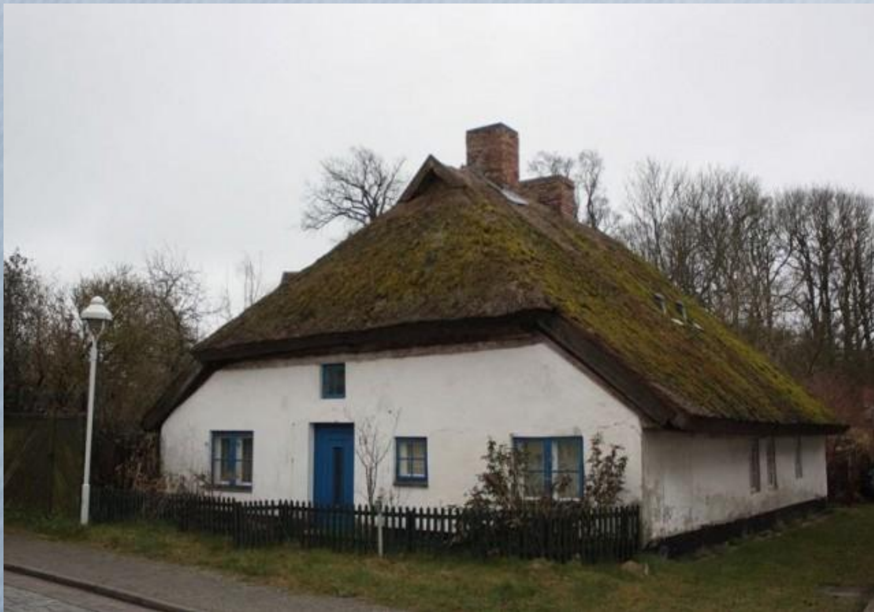
Один из старых типичных домов Альтеркирхена