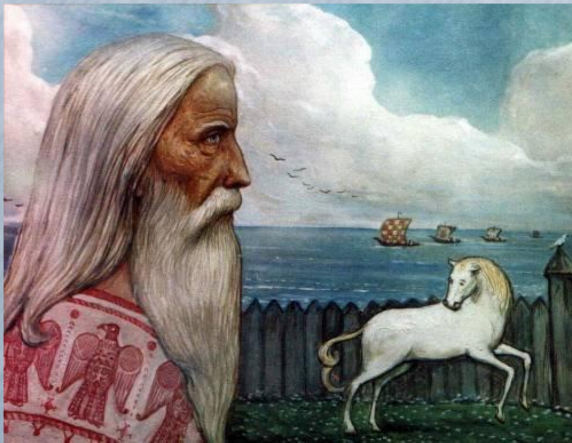
Илья Глазунов "Остров Рюген. Жрец и священный конь Святовита"

В древнерусских сказаниях это остров Буян в море-окияне, там где Камень-Алатырь бел-горюч лежит, Прадуб древний неохватен и могуч стоит, семь небес пронзает и подпирает центр мироздания. Аркона — Ярконь — ярый — огненный белый конь — символ благодати Бога света.