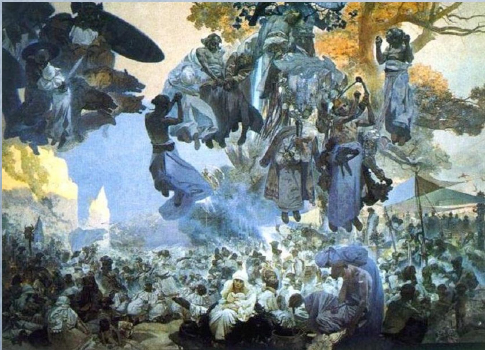
Альфонс Муха "Праздник Свентовита"