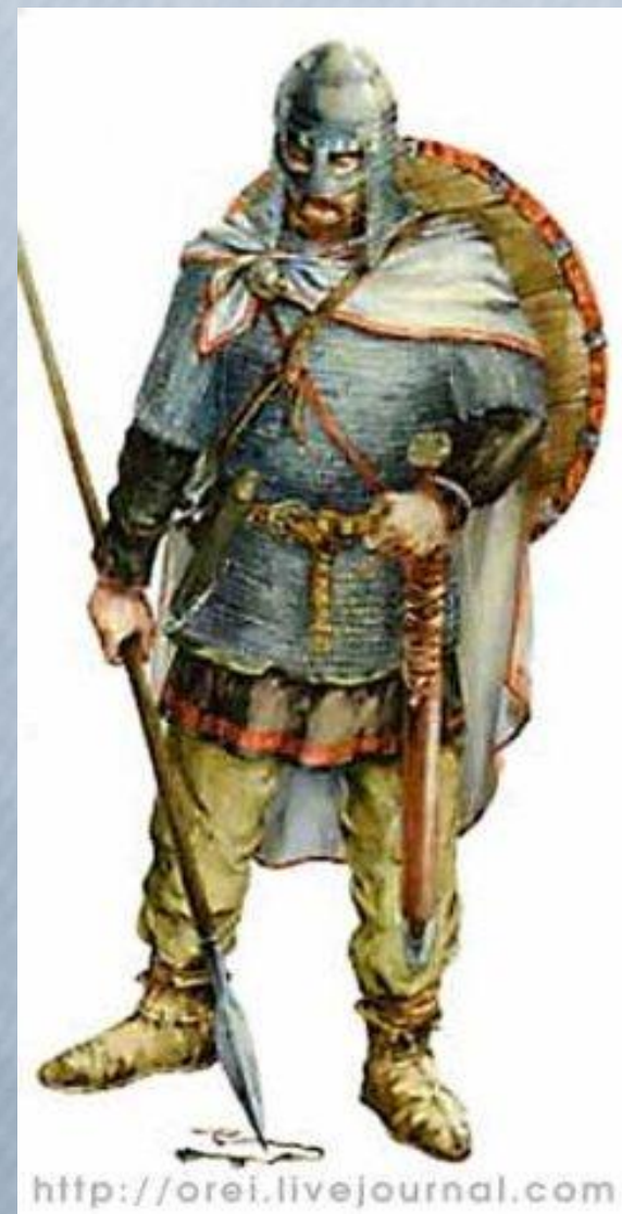
Храмовый воин - ВИТЯЗЬ

Древняя история полабских славян доносит до нас воспоминание о том, что существовал особый вид воинского служения при храмах. Эти храмовые воины и назывались изначально витязями.