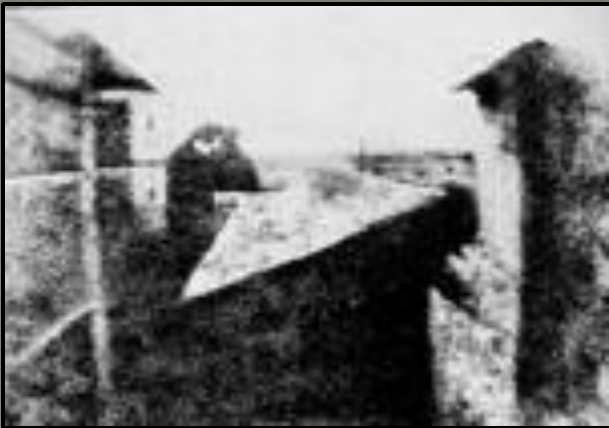
Первая фотография в мире, «Вид из окна», 1826