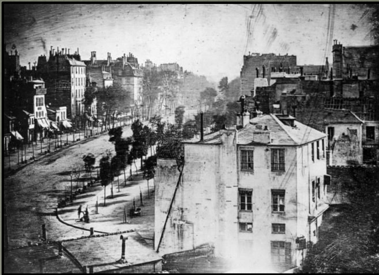
Дагер. Парижский бульвар. 1839 г. 88