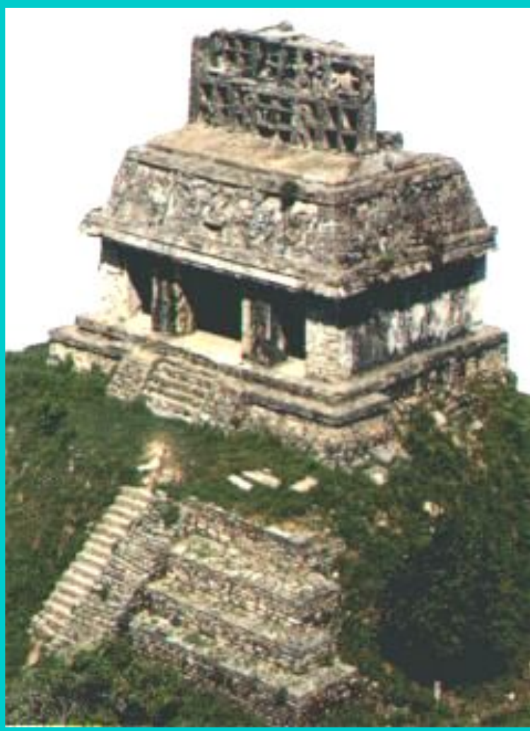
Храм Лиственного креста в Паленке. Мексика. 683 г.

Майя использовали двадцатеричную систему счета, первыми придумали «0».