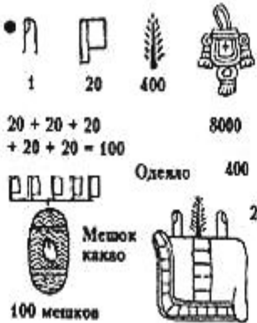
Счет у ацтеков.

Численность армии достигала 150 тыс. Простолыдины за подвиги могли стать знатью.