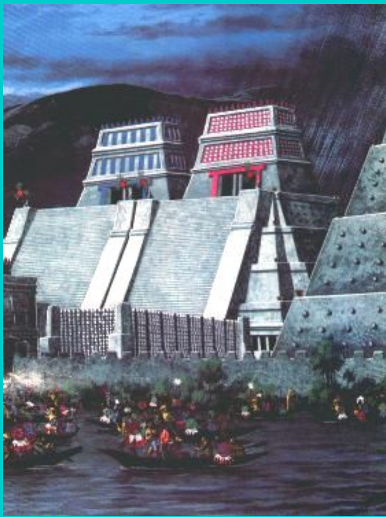
Ацтеки-воины у стен Мехико.

Численность армии достигала 150 тыс. Простолюдины за подвиги могли стать знатью.