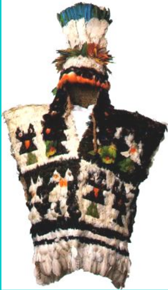
Торжественный наряд Великого Инки.

В Андах, на западе Ю. Аме - рики находилось государс - тво инков, возглавляемое Великим Инкой.