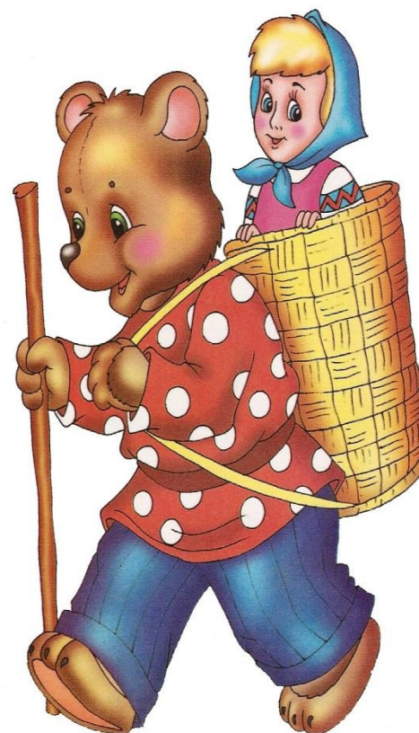
Сказка « Маша и медведь »