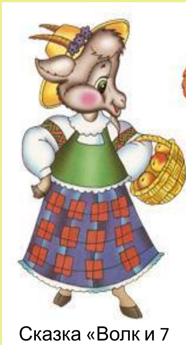
Сказка «Волк и 7 КОЗЛЯТ»