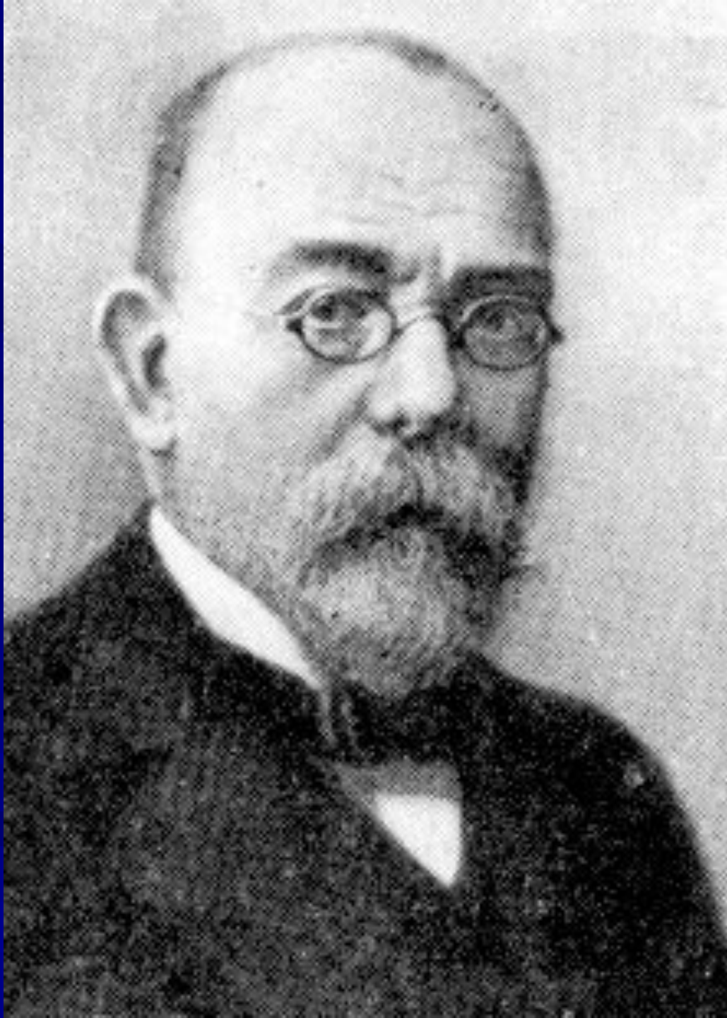
Л. Пастер (1822 - 1895)