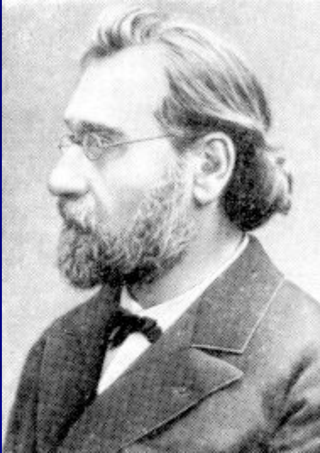
I.I. Мечников (1845 - 1916)