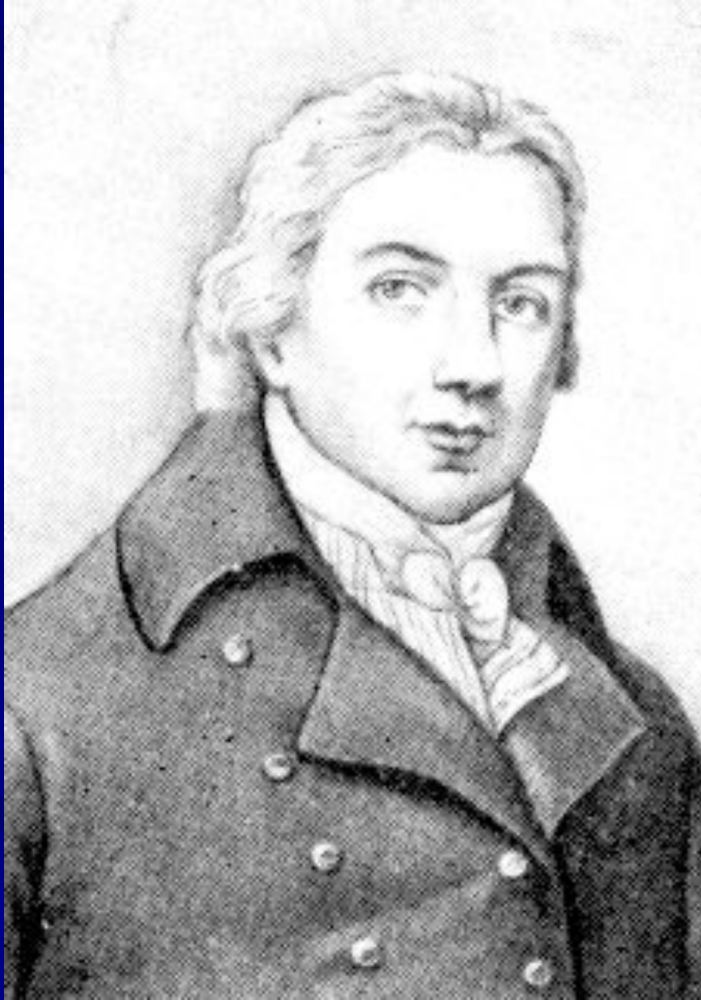
Е. Дженнер (1749 - 1823)