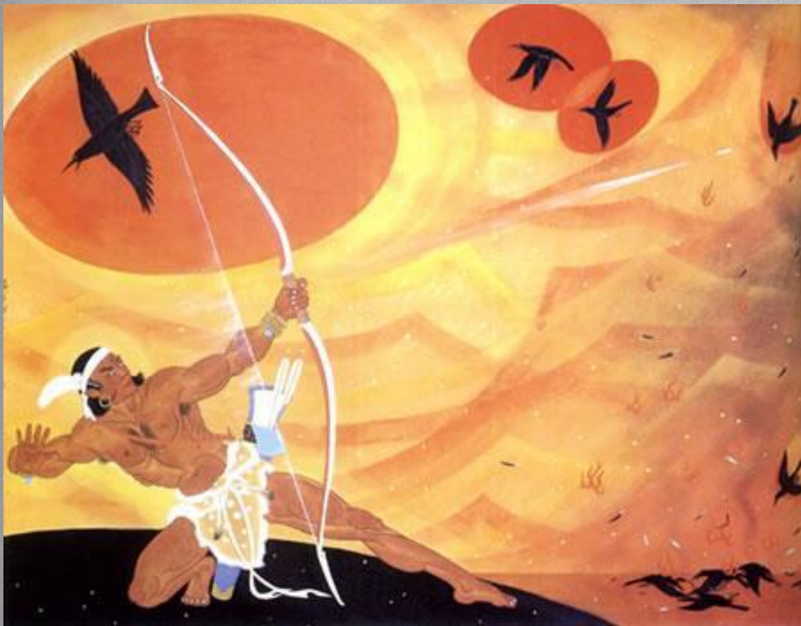
Небесный стрелок И