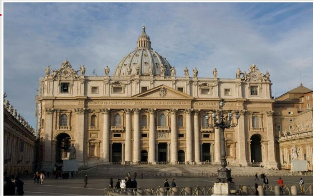
Собор Святого Петра

Первая базилика была построена в 326 году. И только в начале XVII в. по указанию Павла V архитектор Карло Мадерна удлинил восточную ветвь креста.