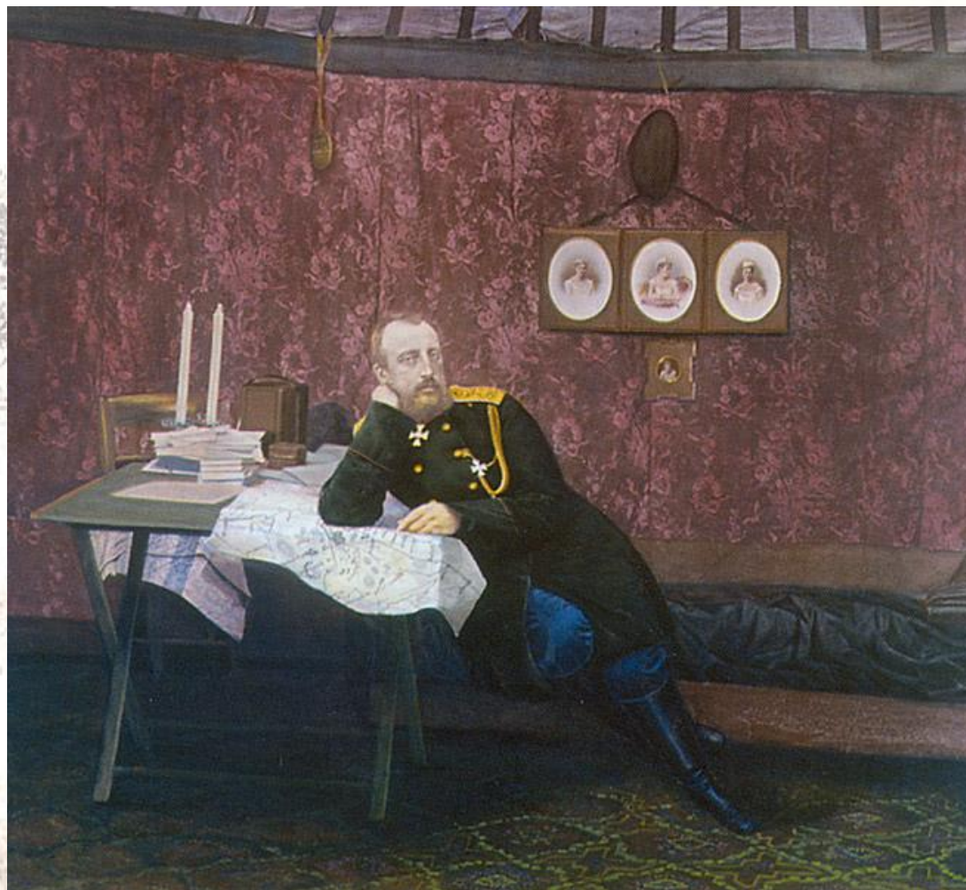
КНЯЗЬ Николай Николаевич