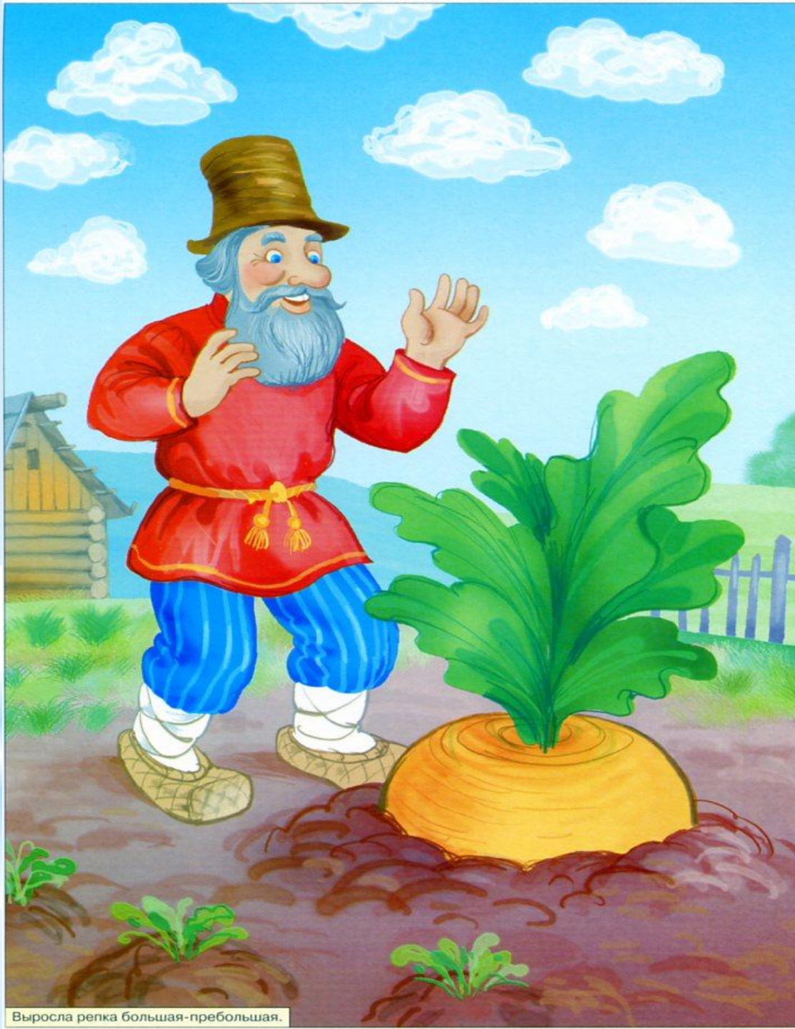
Выросла репка большая-пребольшая.