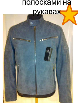
Куртка из нубука в синем цвете со стегаными элементами на