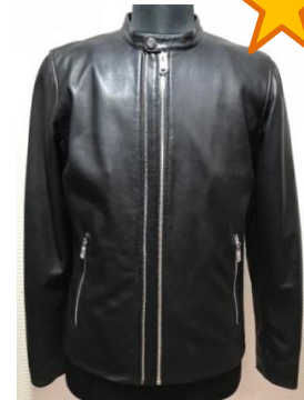
Кожаная куртка с двойной серебристой молнией