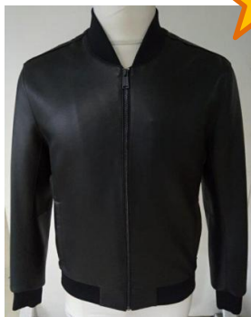
Кожаная куртка «bonded» с окантованными краями