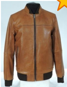
Бомбер из кожи vegetale в рыжем цвете