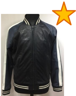
Кожаный бомбер с яркими полосами на рукавах-реглан, манжетах и воротнике