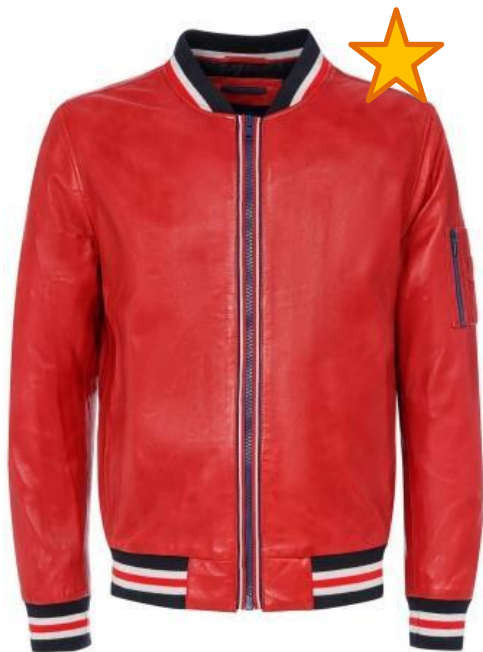
Jorg Weber CASUAL

В коллекции сезона SS19 представлены кожаные куртки в спортивном стиле с контрастными полосами на манжетах, поясе, воротнике и рукавах. В качестве акцента на моделях используется контрастная текстильная тесьма вдоль молнии, или контрастные кожаные вставки на рукавах-реглан.