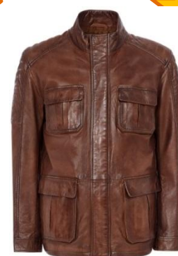
Удлиненная куртка с с эффектом затемненных швов