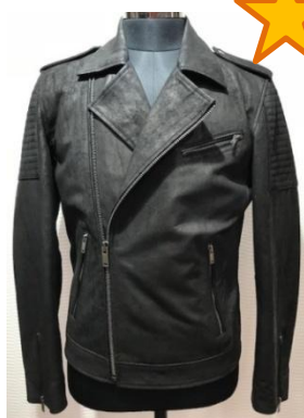
Косуха из шлифованной кожи