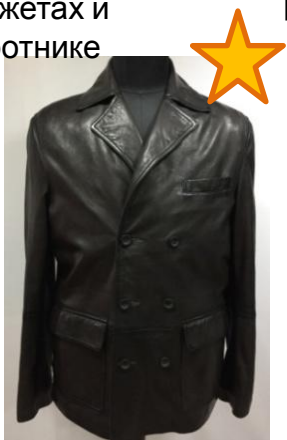
Двубортная куртка – пиджак с эффектом затемненных швов