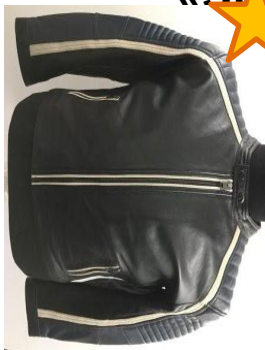
Кожаная куртка в байкерском стиле с контрастными элементами