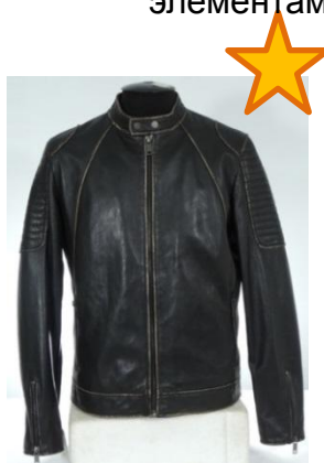
Куртка с эффектом потертой кожи