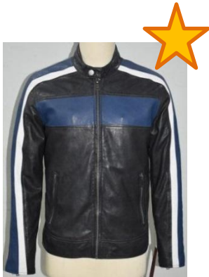
Кожаная куртка с контрастными полосами на рукавах