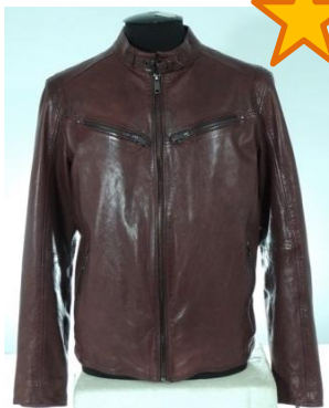
Короткая куртка темно-вишневого цвета из кожи vegetale