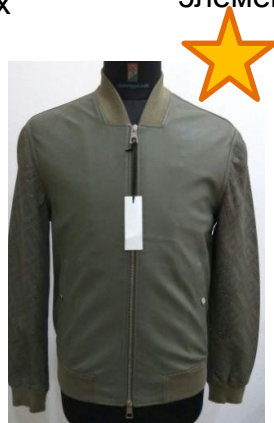
Бомбер с перфорированными деталями в оливковом цвете