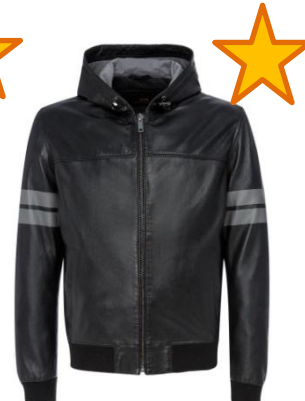
Бомбер с капюшоном и контрастными полосками на рукавах