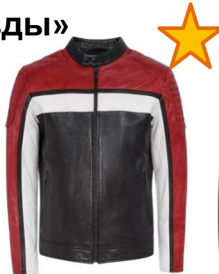
Кожаная куртка в байкерском стиле с контрастными элементами