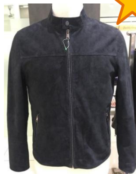
Замшевая куртка в темно-синем цвете