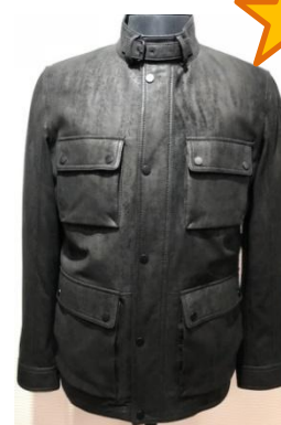
Удлиненная куртка из шлифованной кожи с накладными карманами