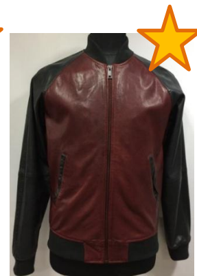
Кожаная куртка с комбинацией двух цветов: темно-красный и графит