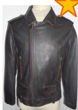
Куртка из кожи с эффектом потертости