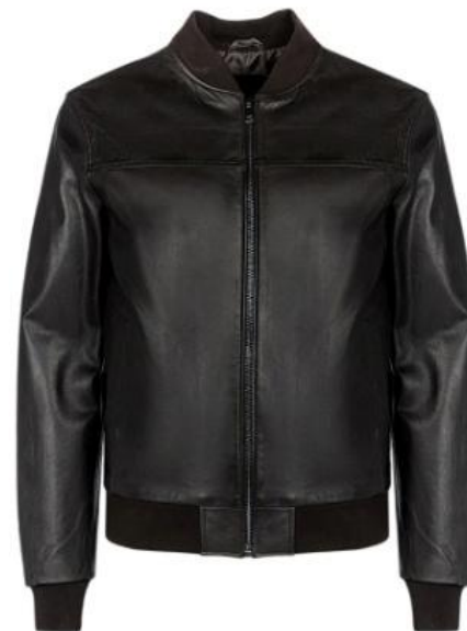
UF4M Темно- коричневый