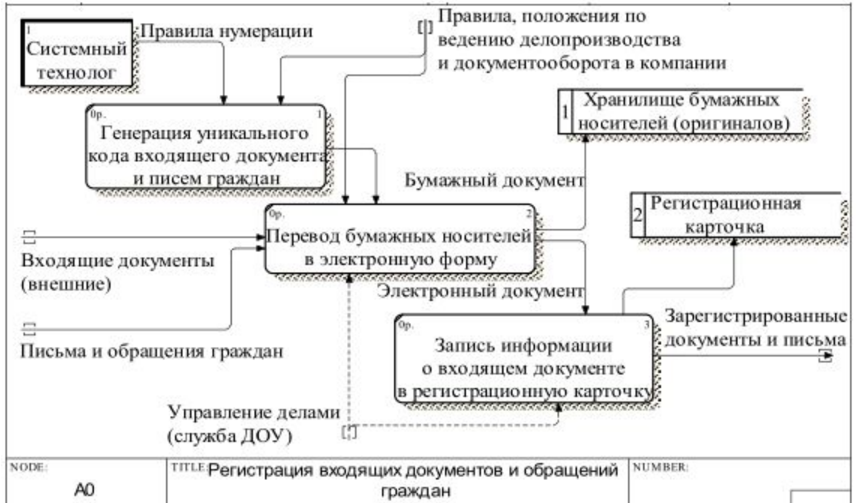
Рис. 3. Диаграмма потоков данных