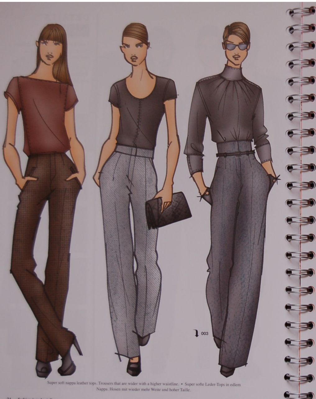
Super soft nappa leather tops. Trousers that are wider with a higher waistline. • Super softe Leder-Tops in edlem Nappa. Hosen mit wieder mehr Weite und hoher Taille.