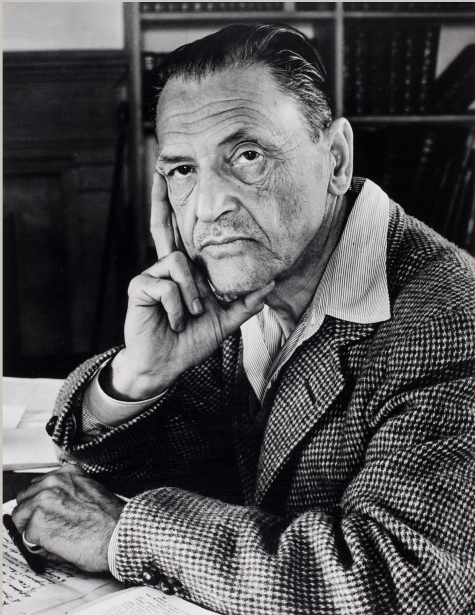
Писатель Уильям Сомерсет Моэм, Южная Каролина, США, 1942 год.