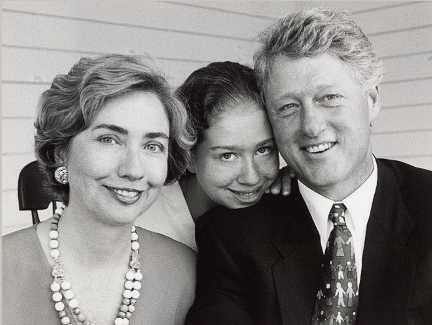
Билл Клинтон в окружении семьи