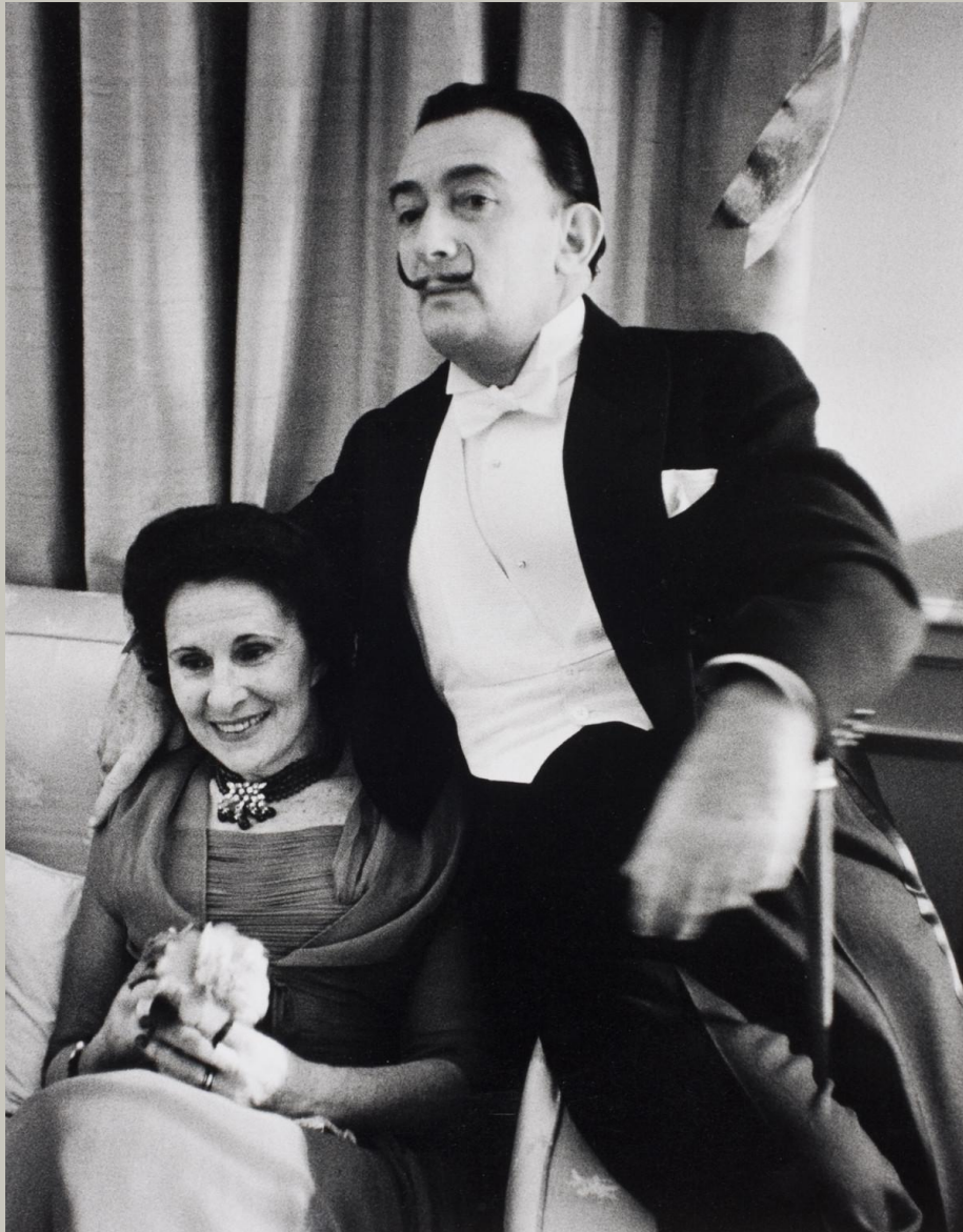
Сальвадор Дали с женой на новогодней вечеринке в Нью-Йорке, январь 1956 года.