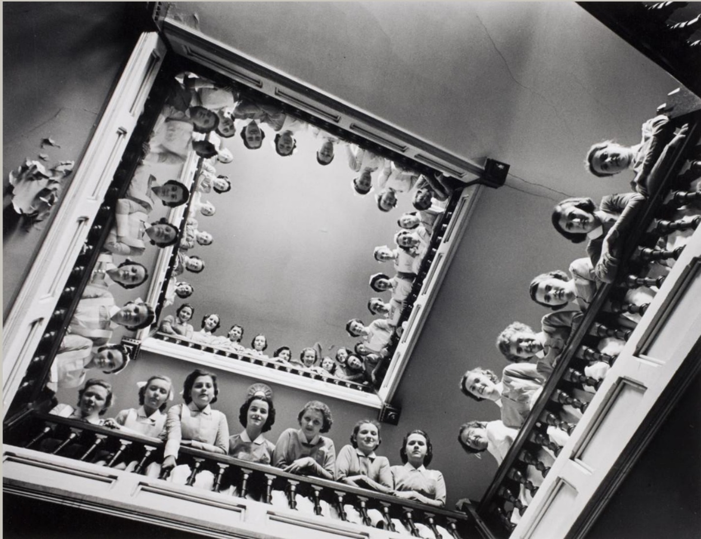
Студентки-медсёстры в больнице Рузвельта, Нью-Йорк, 1938 год.