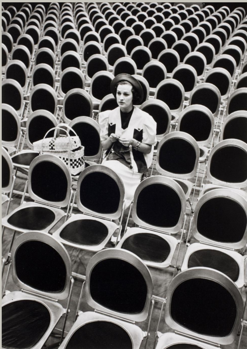
Певица Джейн Форман на студии NBC 4Н в Нью- Йорке, 1937 год.