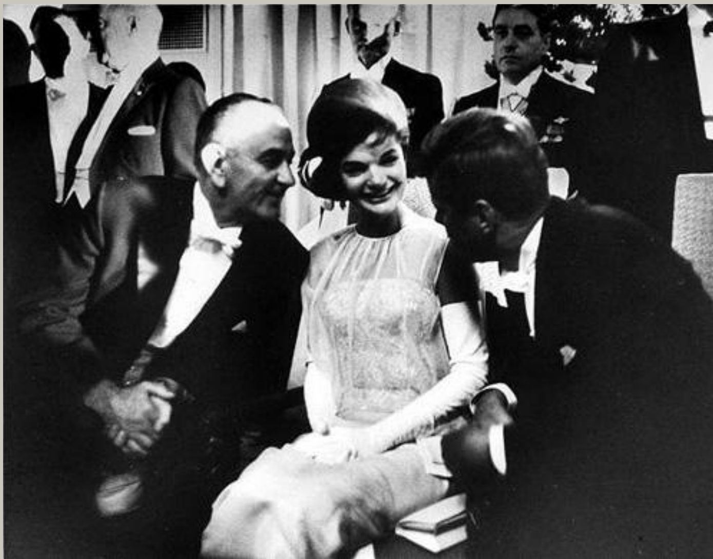
Жаклин Кеннеди в окружении мужчин