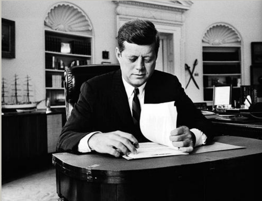
Президент Кеннеди и его жена Жаклин Кеннеди-Онассис