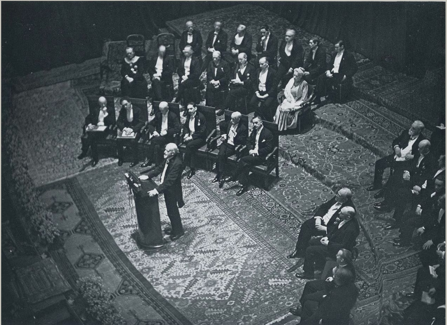
Церемония вручения Нобелевской премии в Стокгольме