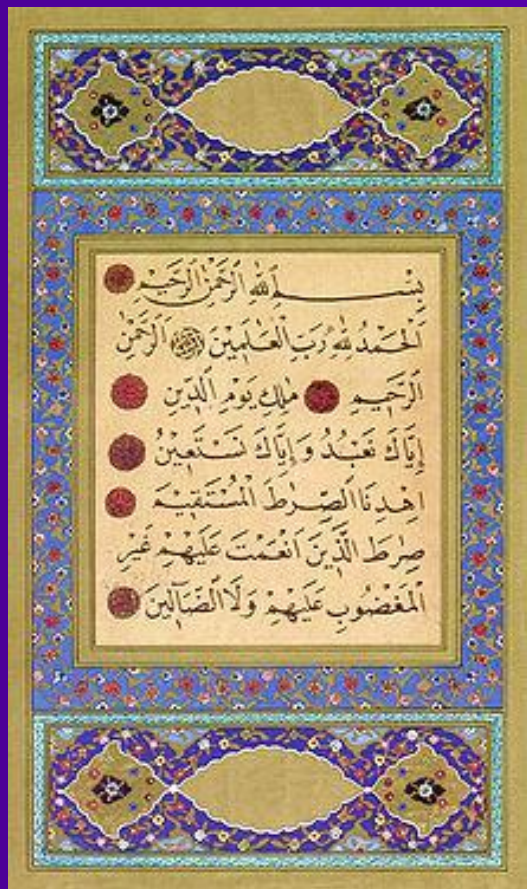
Первая сура Корана