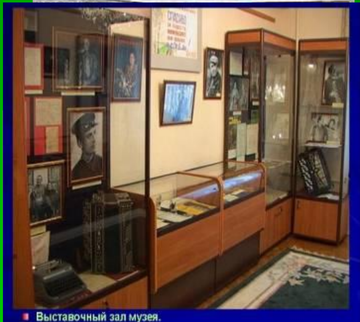
■ Выставочный зал музея.