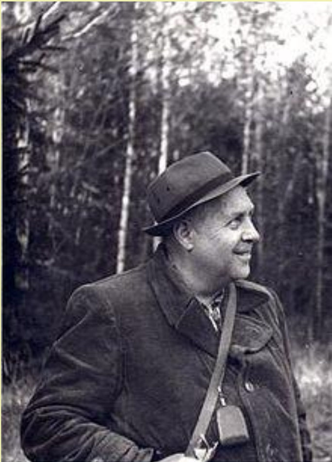
Георгий Алексеевич Скребицкий