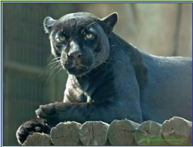
Чёрный ягуар, или пантера

Нередко встречаются животные-меланисты. Черные ягуары заметно крупнее и спокойнее обычных.