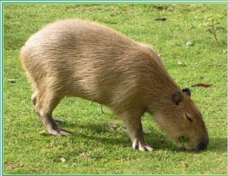
Капибара (водосвинка) – самый крупный грызун на земле, весащий 50 кг