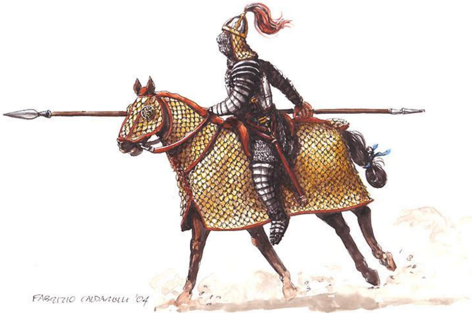
Парфянский катафркт (тяжеловооруженный кавалерист)