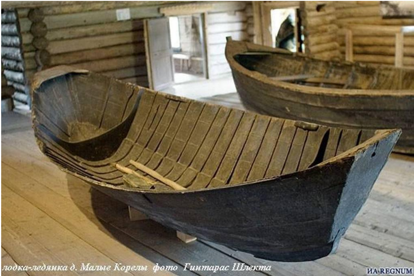
лодка-ледянка д. Малые Корелы